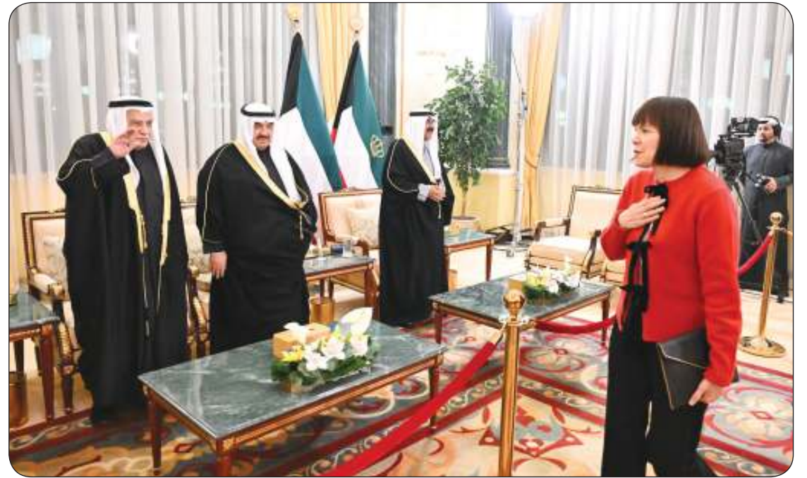
رؤساء البعثات الدبلوماسية شاركوا بتهنئة سمو الأمير وولي العهد وأسرة آل الصباح.. وهنا تبدو السفارة الأمريكية مهنته

رمضان المبارك، لليوم الثاني على التوالي، حيث استقبل سمو الأمير وسمو ولي العهد وكبار الشيوخ، رؤساء البعثات الدبلوماسية المعتمدين لدى دولة الكويت، وكبار القادة في الجيش والشرطة والحرس الوطني وقوة الإطفاء العام، وجموعاً من المواطنين والمقيمين.