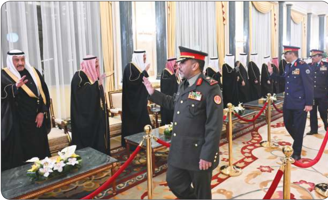
كبار قادة الجيش والشرطة والحرس الوطني و«الإطفاء» باركوا لصاحب السمو الأمير وولي العهد بقدم الشهر الفضيل

تجليات المناسبة المباركة تعبر عن وحدة الشعب الكويتي وأصالته وأواصر الأخوة التي جبل عليها دوماً