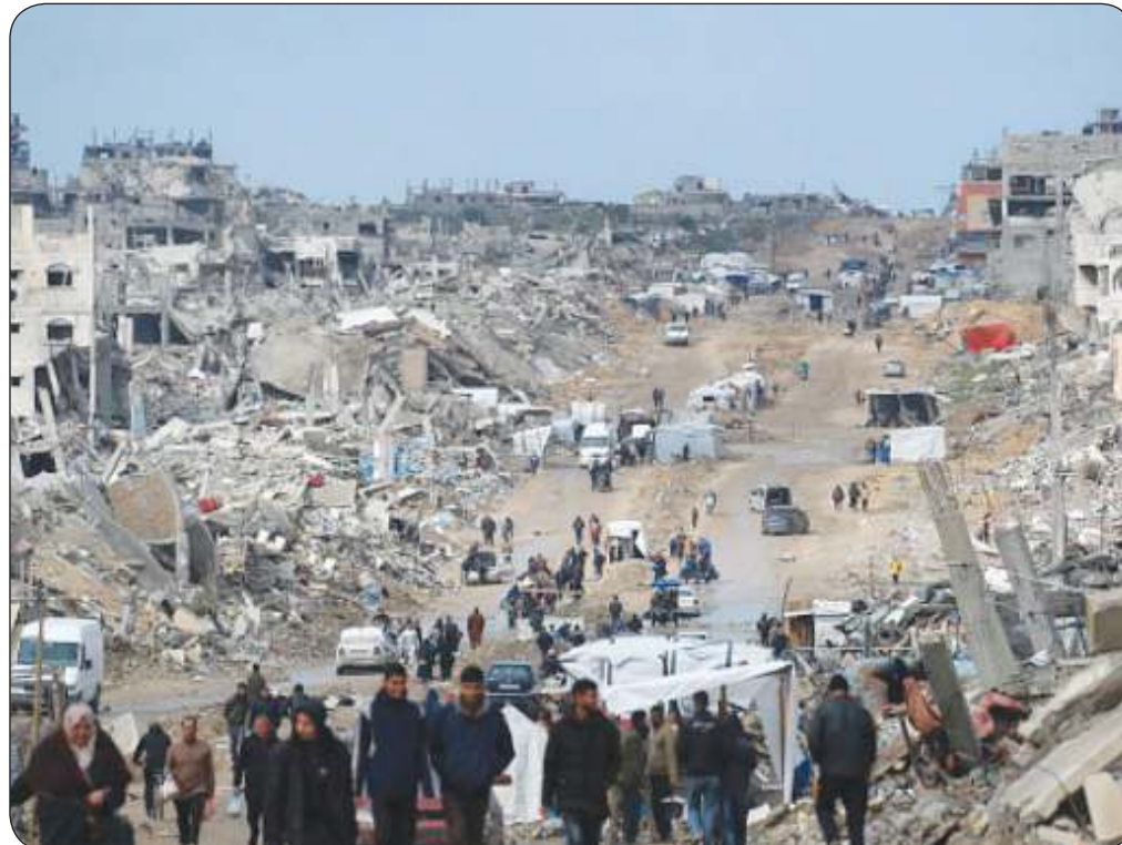
الخطة المصرية لإعمار غزة ستشكل بديلاً لخطة ترامب المرفوضة

أعربت وزارة الخارجية عن إدانة دولة الكويت واستنكارها الشديد، لقرار سلطات الاحتلال الاسرائيلي منع دخول المساعدات الإنسانية لقطاع غزة. وأكدت «الخارجية» في بيان لها أمس، أن هذا الإجراء يعتبر انتهاكاً صارخاً للقانون الدولي، ومخالفاً للمبادئ الأساسية للقانون الدولي الإنساني، غير أنه بالآثار الوحشية التي خلفتها الحرب على غزة. وجددت موقف دولة الكويت المطالب بوقف مثل تلك القرارات والسياسات، التي لا تراعي المبادئ الإنسانية، وتمنع الأشقاء الفلسطينيين من أبسط حقوقهم وتستخدم سياسة التجويع للضغط عليهم، وفي شهر رمضان المبارك.