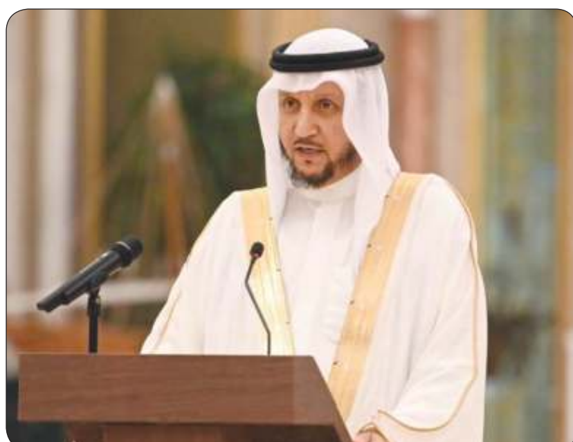
نائب رئيس مجلس الوزراء وزير الدولة لشؤون مجلس الوزراء شريدة المعوشرجي

توفير فرص عمل في 11 جهة حكومية للكويتيين حملة الثانوية والمتوسطة والابتدائية