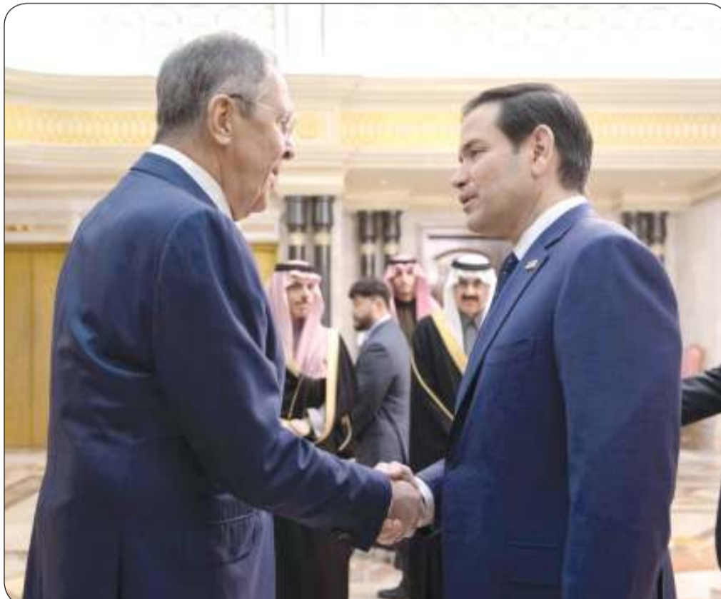
وزير خارجية الولايات المتحدة وروسيا خلال لقاءهما في الرياض برعاية سعودية أمس

روبيو: هناك فرص استثنائية للشراكة مع روسيا إذا انتهت الحرب مع أوكرانيا لافروف: نشعرنا برغبة الحسم من الأمريكيين بالسير قدماً بهذا الحراك للأمام بشكل نشط وسنعمل على ذلك