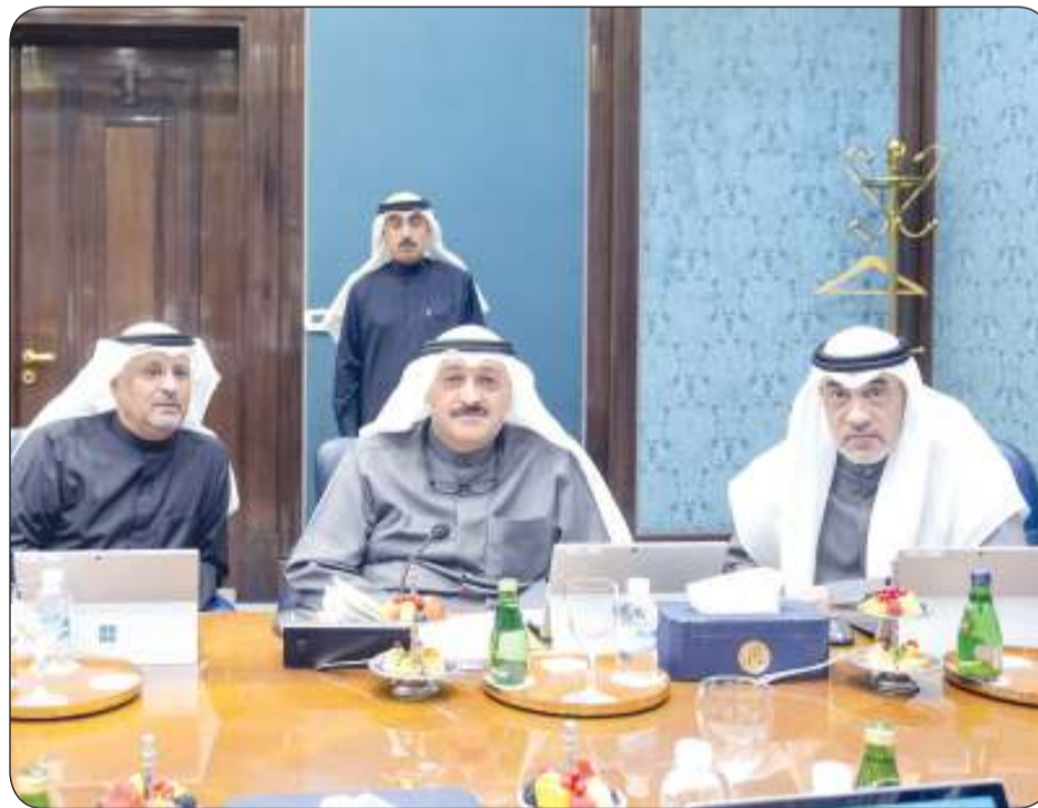
الشيخ فهد اليوسف مترئسا الاجتماع الأسبوعي لمجلس الوزراء أمس

كشف عن زيارة رئيس مجلس الوزراء المصري للبلاد السبت المقبل