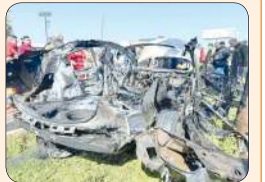
سيارة القيادي في «حماس» محمد شاهين بعد استهدافه إسرائيل لها أمس