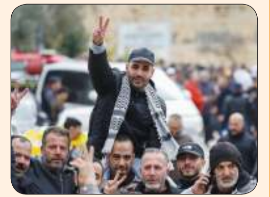
أسير فلسطيني يرفع شارة النصر خلال الاحتفال باستقباله في رام الله أمس