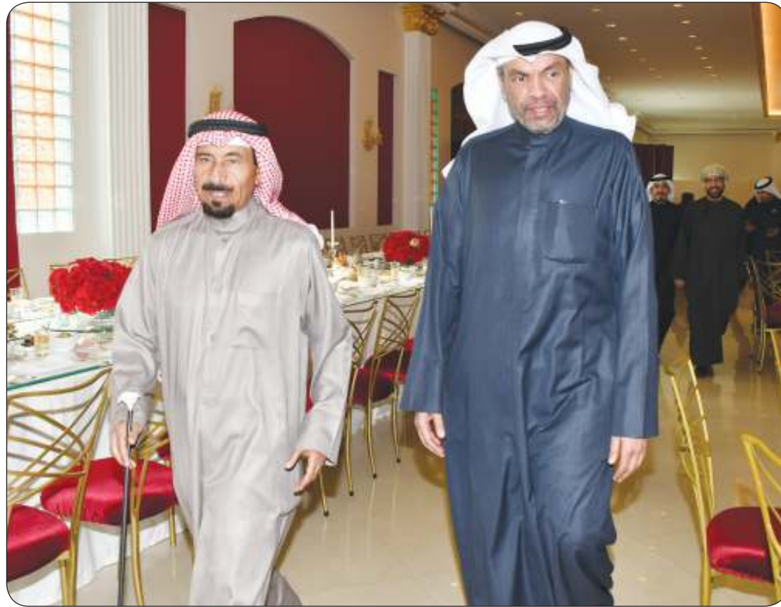
وزير الخارجية عبد الله اليحيا شارك الشيخ علي الجابر في الاحتفاء بالدبلوماسيين وعائلاتهم في عزازير

أكد النائب الأول لرئيس مجلس الوزراء وزير الداخلية الشيخ فهد اليوسف، أهمية «المنتدى الإقليمي السادس للحد من مخاطر الكوارث»، الذي تستضيفه دولة الكويت اليوم الأحد، حيث يركز على تعزيز جهود الاستعداد والتعافي بهدف بناء مستقبل أكثر أماناً لدول المنطقة. وقال الشيخ فهد اليوسف لـ «كونا» أمس، إن المنتدى الذي يستمر حتى 12 فبراير الجاري، يعد تجمعا بالغ الأهمية، يهدف إلى تعزيز المعرفة بمخاطر الكوارث وتعزيز الحكمة وتشجيع الاستثمارات في مجال القدرة على الصمود في المنطقة العربية. أضاف أن المنتدى الذي يعقد تحت شعار «بناء مجتمعات عربية قادرة على الصمود: من الفهم إلى العمل» سيتوج بإعلان الكويت «وهو إعلان سياسي يهدف إلى الحد من مخاطر الكوارث، ويعكس التزام الدول العربية بتسريع تنفيذ إطار «سنداي» والإستراتيجية العربية للحد من مخاطر الكوارث، وأوضح أن المنتدى الذي يعقد بالتعاون مع مكتب الأمم المتحدة للحد من مخاطر الكوارث وبالشراكة مع