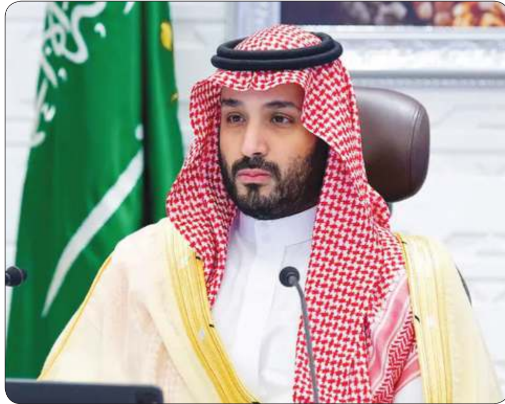
ولي العهد السعودي خلال مشاركته في الاجتماع الافتراضي الاستثنائي لقادة مجموعة بريكس والذي انتم فيه لغزة وفلسطين

أعلنت رئاسة الأركان العامة للجيش الكويتي أمس، عن إجراء مراسم القرعة العلنية لاختيار الطلبة الضباط حملة الشهادات الجامعية الدفعة الـ 24، بحضور وزير الدفاع الشيخ عبد الله العلي الصباح. وقالت «الأركان» في بيان صحفي، إن القرعة العلنية التي أجريت في مبنى متعدد الأغراض بمعسكرات المباركية بمشاركة 459 مقترعاً من مختلف التخصصات الجامعية، ستسفر عن اختيار 150 مرشحاً أساسياً و30 احتياطياً موزعين على 20 تخصصاً للانضمام إلى شرف الخدمة العسكرية.