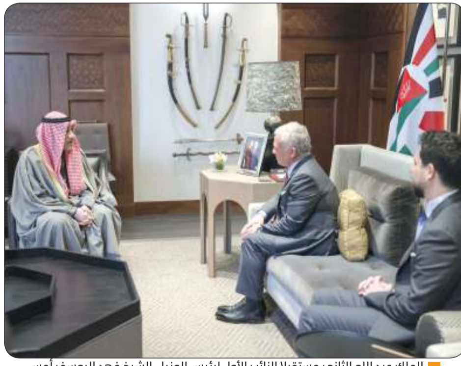
الملك عبد الله الثاني مستقبلاً النائب الأول لرئيس الوزراء الشيخ فهد اليوسف أمس

برنامج «الغذاء العالمي»: الاحتياجات الإنسانية في القطاع هائلة بالتزامن مع عودة الأسر النازحة إلى مناطقها شمالاً