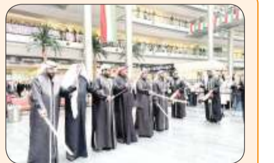
وزير التربية يعرض مع الفرقة الشعبية وسط أجواء مفعمة بالوطنية