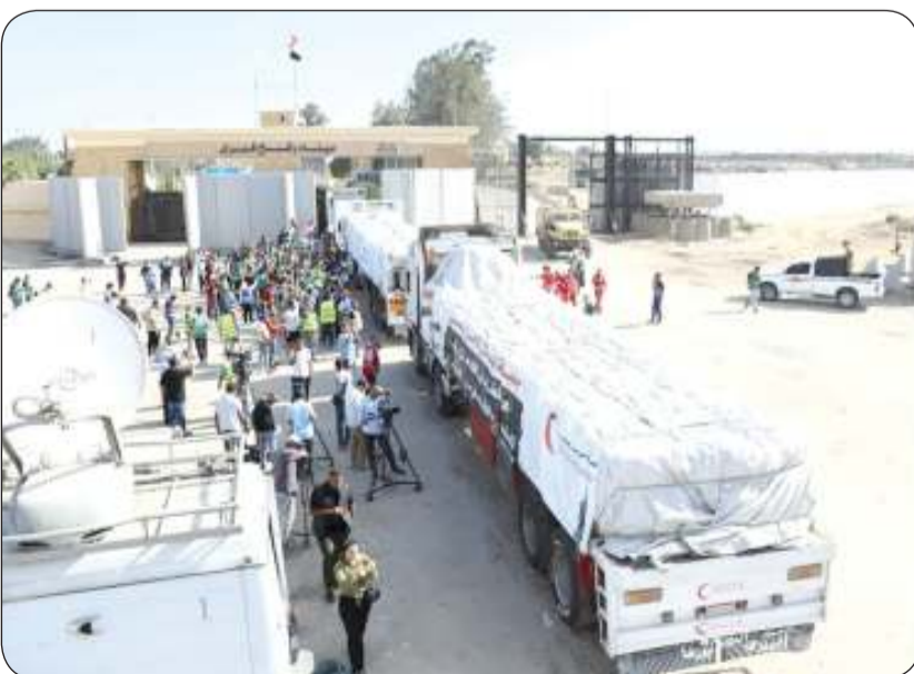
الشاحنات التي دخلت القطاع تحمل مساعدات بيسيرة لغزة المدمرة وإسرائيل لا تزال تضع العراقيل أمامها