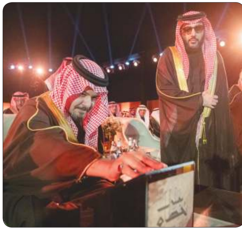
سمو الأمير سلمان بن سلطان يحدش المشروع بحضور المستشار تركي آل الشيخ

شكل لجنة «تقصي حقائق» بشأن عدم تنفيذ 100 ألف قرار إداري ذات أثر مالي ومترابطة منذ سنوات الطببائي: 12 مليون دينار تجاوزات مالية في «التربية»