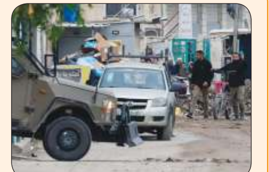
جيش الاحتلال الإسرائيلي واصل أمس عملياته العسكرية في جنين

طهبوب لـ الصباح: لا تهجير الشعب الفالسطيني.. ونكبة 48 لن تتكرر