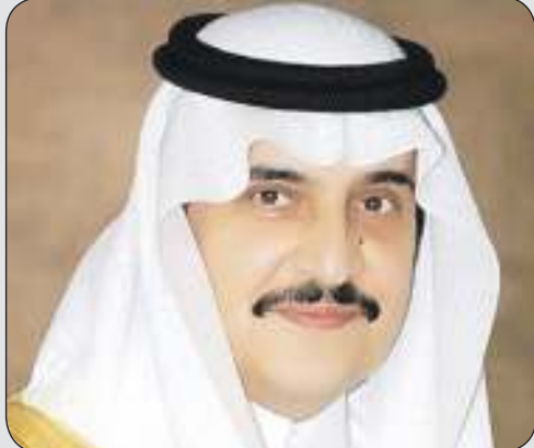
المغفور له بإذن الله الأمير محمد بن فهد

الكويت عزت بوفاة الأمير محمد بن فهد أحد أبطال دعم السمود الكويتي خلال الغزو الفاشم