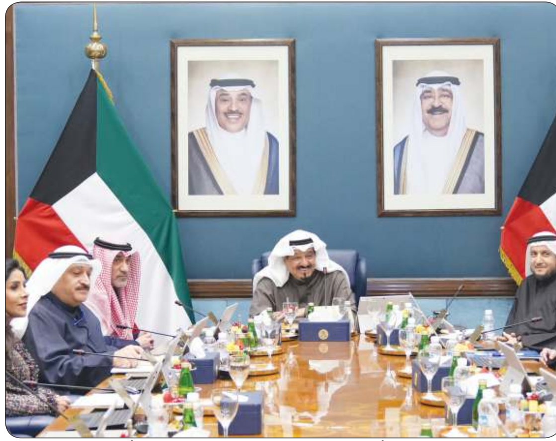
سمو الشيخ أحمد العبد الله مترئسا الاجتماع الأسبوعي لمجلس الوزراء أمس

إقرار نظام «مكنة حسابات البعثات الدبلوماسية» بهدف وضع إستراتيجية لتلاني كل الملاحظات الواردة من الجهات الرقابية تمكين وزارة الخارجية من تسريع إنجاز معاملات الحسابات التابعة للمكاتب العسكرية والثقافية والصحية عبر سفارات الكويت بالخارج بوشهري أحاط المجلس علماً بإجراءات وزارة الكهرباء بشأن «الوثيقة البيضاء» حول تحول الطاقة في البلاد توقيع مذكرة تفاهم مع شركة عالمية كمطور ومشغل ومستثمر لإنشاء محطة لتوليد الكهرباء بطاقة إجمالية 3 آلاف ميغاوات وفقاً لنظام «المزود المستقل»