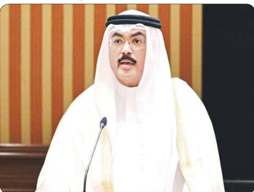
وزير التربية جلال الطببائي

شكل لجنة «تقصي حقائق» بشأن عدم تنفيذ 100 ألف قرار إداري ذات أثر مالي ومترابطة منذ سنوات الطببائي: 12 مليون دينار تجاوزات مالية في «التربية»