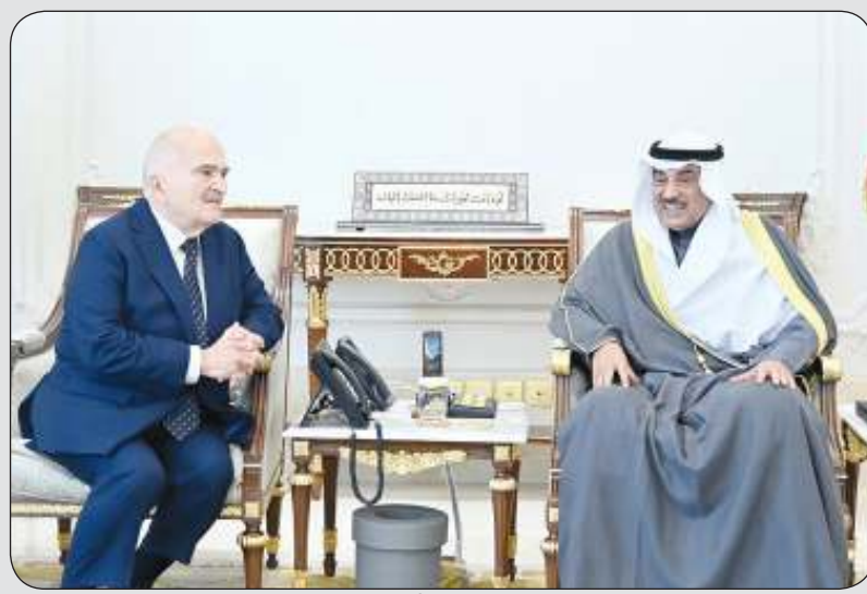
سمو ولي العهد استقبل أيضا الأمير الحسن بن طلال