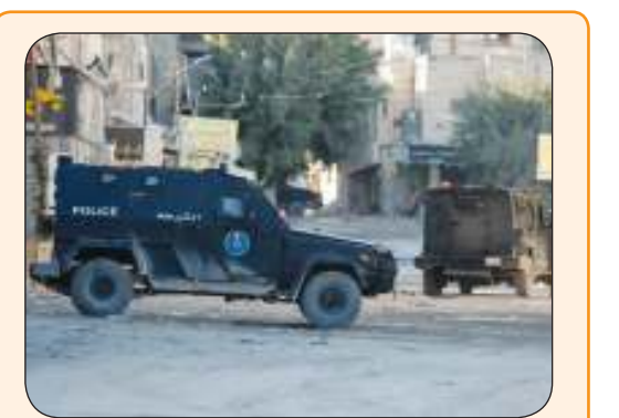
أجهزة أمن السلطة الفلسطينية تنسحب من محيط مخيم جنين

رئيس الأركان الإسرائيلي يستقيل ويعترف بـ «الفشل»... والاحتلال يهاجم جنين