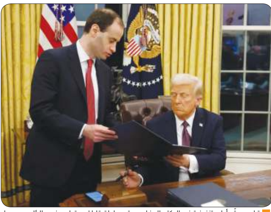
ترامب يوقع أوامر تنفيذية في المكتب البيضاوي عقب ساعات قليلة من توليه منصبه الرئاسي رسمياً

توجه لفرض رسوم جمركية على كندا والمكسيك واستعدادات لمواجهة اقتصادية مع الصين