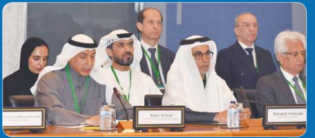
الإمضاء: أزمة مياه بالشرق الأوسط وشمال أفريقيا بحلول 2050

الأربعاء 22 رجب 1446 هـ 22 يناير 2025 م السنة السابعة عشرة