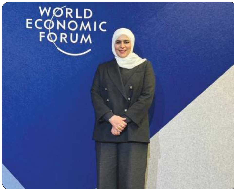
وزيرة المالية نورة الفصام خلال مشاركتها في منتدى دافوس

من جهة أخرى، أكد الشيخ نواف الصباح الاهتمام الكبير الذي توليه دولة الكويت بالجوانب البيئية في عملياتها.