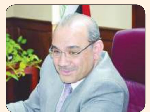
السفير المنهل الصافي

السفير الصافي لـ الصباح: تعاون أمني كبير بين الإنتربول العراقي والكويتي لتبادل المتهربين