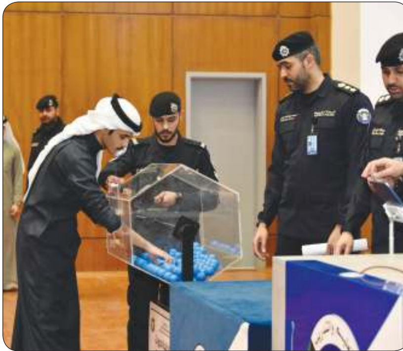
جانب من إجراءات سحب القرعة العلنية للدورات المتخصصة في «الداخلية»

ملتزمون تماماً بتوجيهات القيادة السياسية بشأن هؤلاء الموظفين ودعم تعزيز الشفافية وتطبيق القوانين في كل القطاعات ضرورة التعاون بين الإدارات المدرسية والجهات المختصة لضمان سير العمل بشكل منظم وحفاظاً على مصلحة الجميع