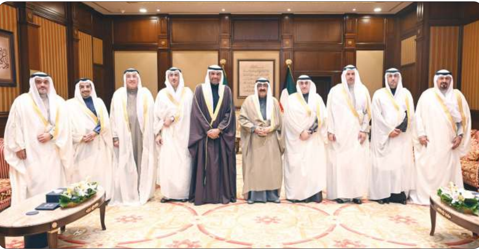
سمو أمير البلاد استقبل أمس وزير الخارجية ورؤساء البعثات الدبلوماسية والقنصلية الجدد

سموه يمضي على نهج أسلافه الكرام في مسيرة الإنجاز والريادة للكويت وعهد ميمون ملؤه الأمل بغد زاهر