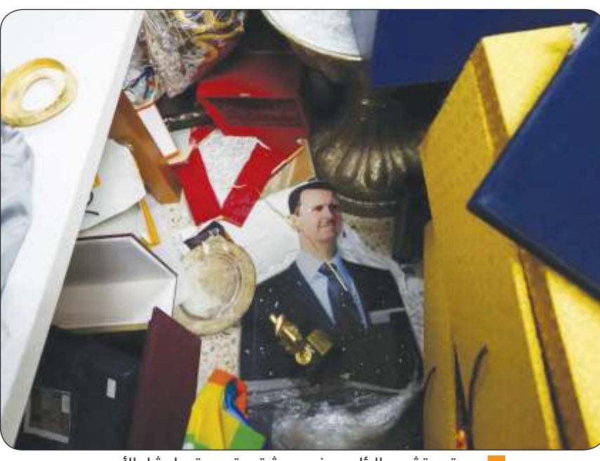
من مقر تشرين الرئاسي في دمشق عقب سقوط بشار الأسد

في أول تصريح منسوب إليه منذ سقوطه وسيطرة فصائل المعارضة على الحكم بشار الأسد من موسكو: لم أغانر بشكل مخطط له!