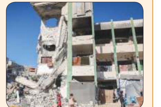
أطفال أمام مدرسة مدمرة في خان يونس

عشرات الشهداء والمصابين باقتحام الاحتلال مدرسة في بيت حانون