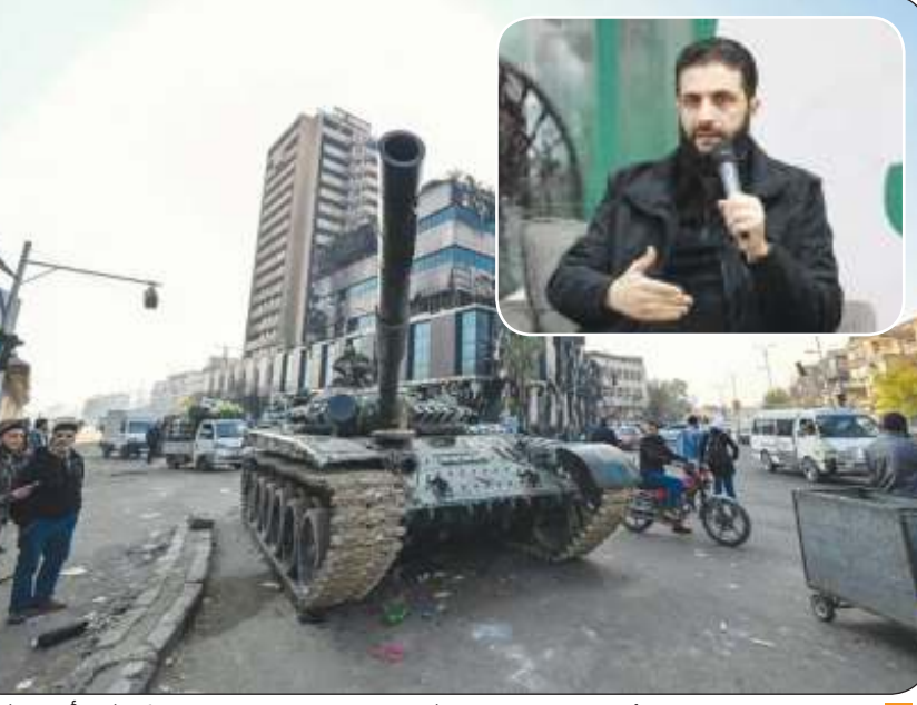
المعارضة السورية سيطرت الأسبوع الماضي على دمشق دون قتال يذكر.. وفي الإطار قائد الثورة أحمد الشرع

وزير الخارجية التركي: بشار تلقى اتصالاً خارجياً طلب منه مغادرة العاصمة دمشق