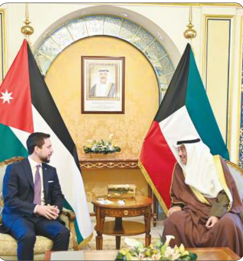
سمو ولي العهد الشيخ صباح الخالد أجرى أمس مباحثات مع ولي العهد الأردني

الخالد والحسين بن عبد الله: توسيع أطر التعاون بين بلدينا بما يخدم مصالحهما الثنائية وتعزيز مسيرة العمل العربي المشترك