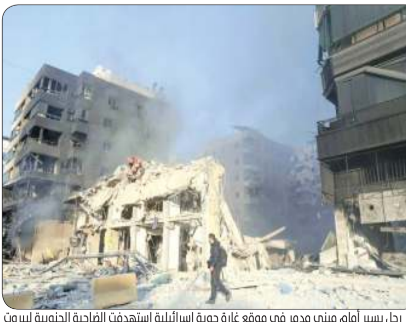
رجل يسير أمام مبنى مدمر في موقع غارة دوية إسرائيلية استهدفت الفاحية الجنوبية لبيروت