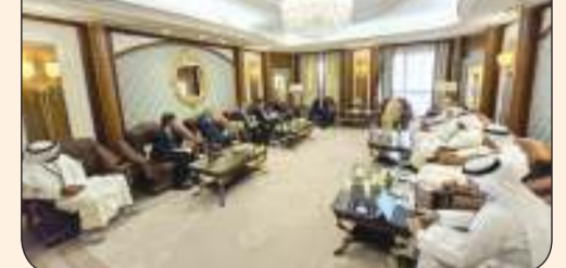
وزيرة المالية نورة الفصام خلال اللقاء مع ممثلي الشركات العالمية