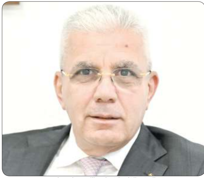
السفير الفلسطيني لدى الكويت رامي طهبوب

عشرات الشهداء في الجنوب اللبناني وقصف واسع لقواعد عسكرية ومستوطنات إسرائيلية