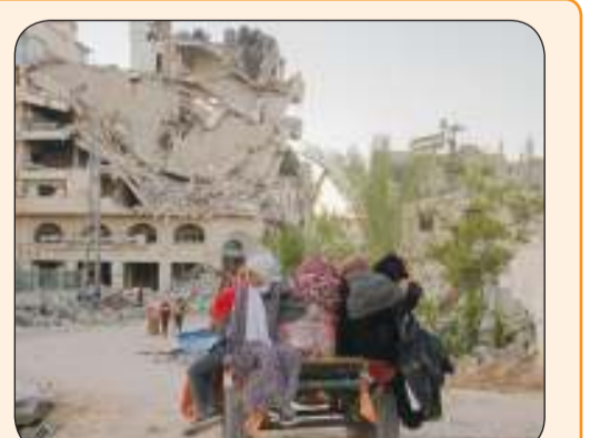
ما دمره الاحتلال الصهيوني في غزة يحتاج إلى سنوات وأموال طائلة لإزالة آثاره

مسؤول أممي: 50 مليار دولار كلفة إعمار قطاع غزة