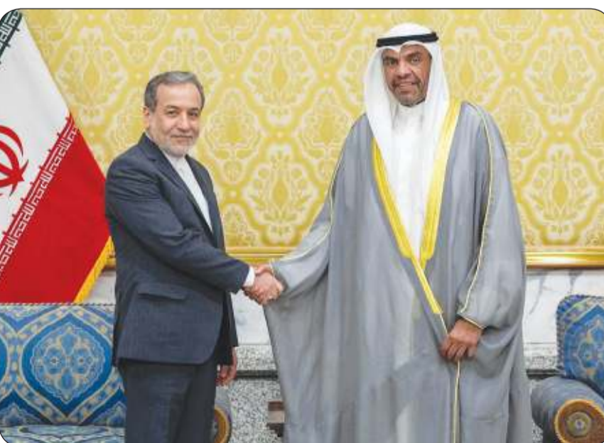
وزير الخارجية عبد الله الجحيا مستقبلاً نظيره الإيراني أمس

الاحتلال ارتكب أبشع الجرائم ووقف إطلاق النار يصدر من اللبنانيين والفلسطينيين إذا هاجمتنا إسرائيل فسيكون هناك رد مائل والمنشآت النووية.. خط أحمر بلادي جادة في انتاج سياسة حسن الجوار وتطوير العلاقات لاسيما مع دول الخليج