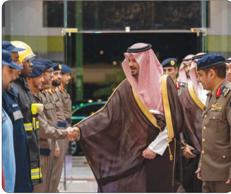
أمير المدينة المنورة يقوم بسلسلة من الجولات والزيارات والافتتاحات سعياً لتطوير المنطقة بدعم القيادة الرشيدة

الشكر والعرفان لخادم الحرمين الشريفين وولي عهده الأمين على الدعم الكبير للمدينة المنورة القطاعات العسكرية في المدينة تشهد تطوراً كبيراً في ظل الدعم الذي توليه القيادة الرشيدة لها اهتمام ورعاية القيادة بذوي الإعاقة ومن صور تلك الرعاية مدينة طبية تعليمية للتربية الخاصة