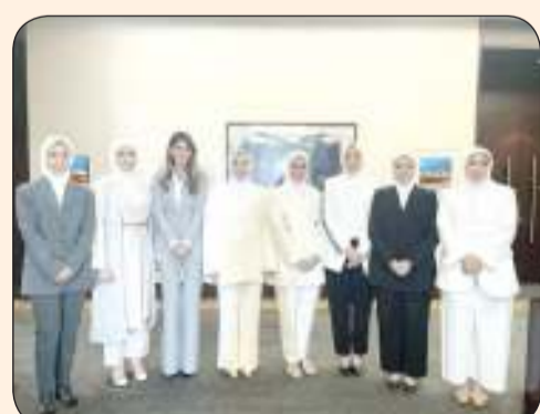
القائمان الكويتيات خلال تكريمهن من المركز الدولي للتعاون القانوني الموحد