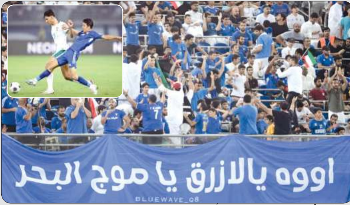
عشرات الآلاف من المشجعين احتشدوا مساء أمس في إستاد جابر لتشجيع المنتخب الكويتي.. وفي الإطار لقطة من المباراة

المشعان : الاهتمام بتطوير البنى التحتية لقطاع النقل الجوي يقع على رأس الأولويات لدى الحكومة