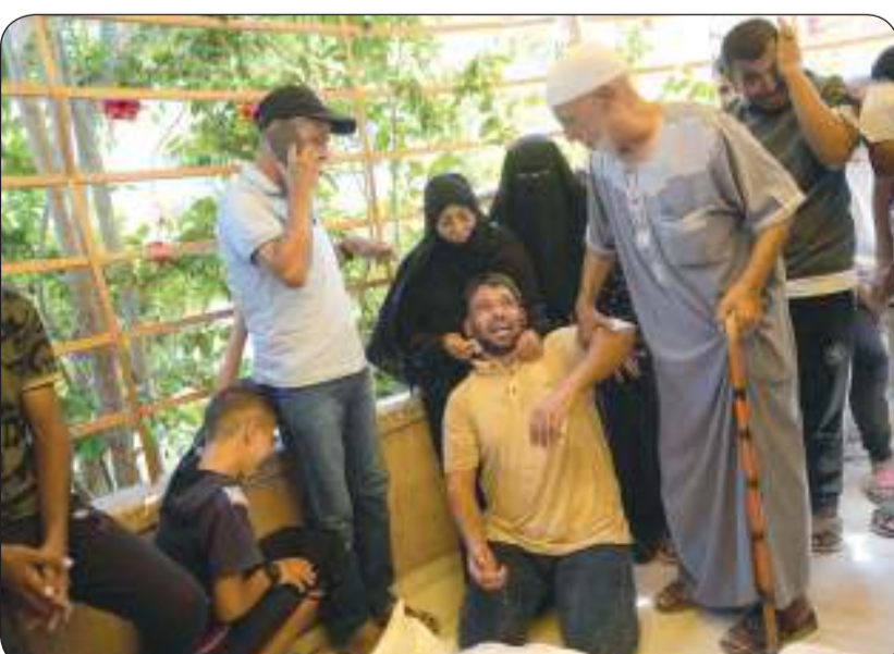
الاحتلال الإسرائيلي يواصل مجازره ضد المدنيين الفلسطينيين في قطاع غزة

الكويت : الاستهداف الوحشي للمدنيين دليل دامغ على أن الكيان الصهيوني يشن حرب إبادة ضد الفلسطينيين