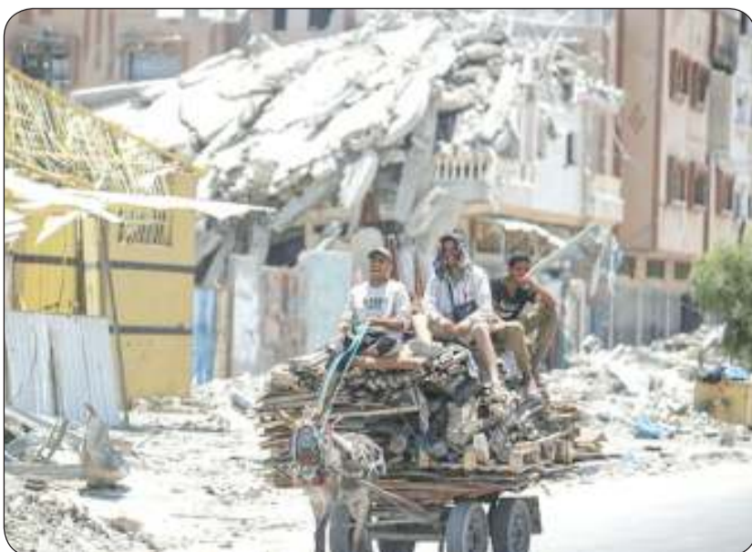
نازحون فلسطينيون يغادرون من شرق خان يونس

مصادر عبرية: لا تزال هناك فجوات يجب تقليصها