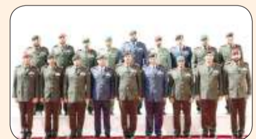
17 ضابطاً كويتياً تخرجوا من أكاديمية جوعان بن جاسم القطرية للدراسات الدفاعية