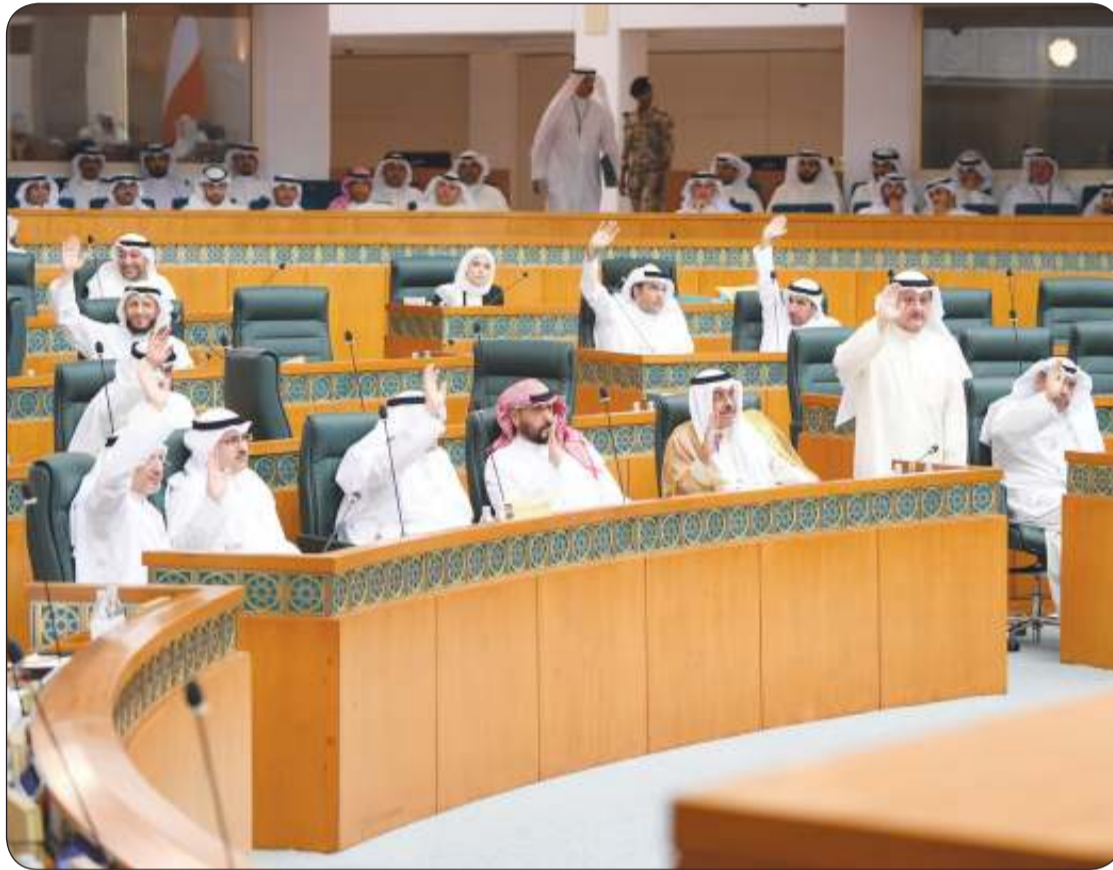
مشروع قانون تنظيم الإعلام يتوقع أن يثير خلافات عديدة بين السلطين خلال الدور المقبل

أكدت وزارة الإعلام، أمس الثلاثاء، حرصها على اتباع جميع الأطر الدستورية والقانونية المتعلقة بمشروع قانون في شأن تنظيم الإعلام، بما يضمن تعزيز مستوى الحريات وتطوير العمل الإعلامي الكويتي. ولقدت الوزارة في بيان صحفي حول ما أثير عن مشروع قانون في شأن تنظيم الإعلام، والذي أعدته الوزارة أخيراً، إلى أنها قامت بعرض مسودة القانون على الجهات الحكومية المعنية، لأخذ كل الملاحظات والمقترحات لإنهاء جميع الإجراءات الرسمية حول مشروع القانون، تمهيداً لإحالته بداية شهر أكتوبر المقبل لمجلس الأمة، لإحالته للجنة التعليمية في مجلس الأمة، كما هو متفق عليه مع أعضاء اللجنة في اجتماع سابق. وشددت الوزارة على حرصها الدائم على التعاون المشترك والتنسيق المستمر مع السلطات التشريعية والتنفيذية في المواضيع ذات الصلة، بما يخدم الإعلام الكويتي ويعزز من الحريات المسؤولة.