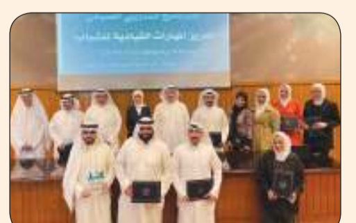
عدد من فريقي برنامج التدريب الصيفي «تنمية المهارات القيادية لدى الشباب»

«العربي للتخطيط»: 2000 متدرب سنوياً من شباب المبادرين بمجالات المشروعات الصغيرة والمتوسطة