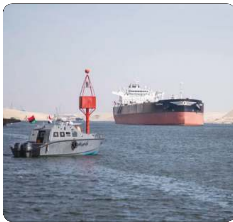
البئر الاستكشافية تزيد امتياز «كوفبيك» إلى 23 ألف برميل يومياً

قمة جوهانسبرغ أرجأت نقاش «العملة الموحدة»، وتبحث تقليل الاعتماد على الدولار