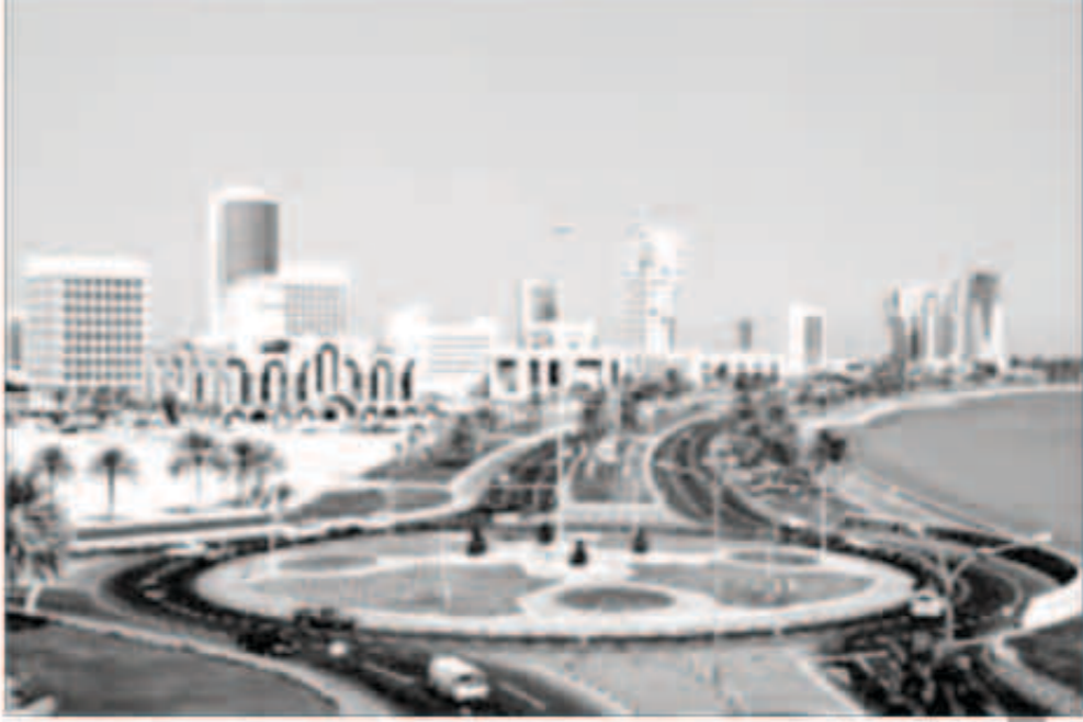
نمو الاقتصاد القطري