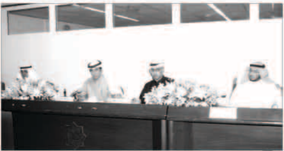
الثاقب خلال عمومية الشركة

وبلغ إجمالي أصول الشركة 93.3 مليون دينار مقارنة بـ 81.7 مليون دينار لعام الذي سبقه بنسبة زيادة بلغت في المدة 14.4. وبلغت صافي حقوق المساهمين 55.2 مليون مقارنة بـ 53 مليون دينار لعام الذي سبقه بنسبة ارتفاع بلغت في المدة 4.4. وكانت عمومية الشركة وافقت على جميع بنود جدول أعمال الجمعية العمومية العادية للشركة والتي من أهمها الموافقة على عدم توزيع أرباح عن السنة المالية المنتهية 31 أكتوبر 2012 والموافقة على اعتماد البيانات المالية للشركة.