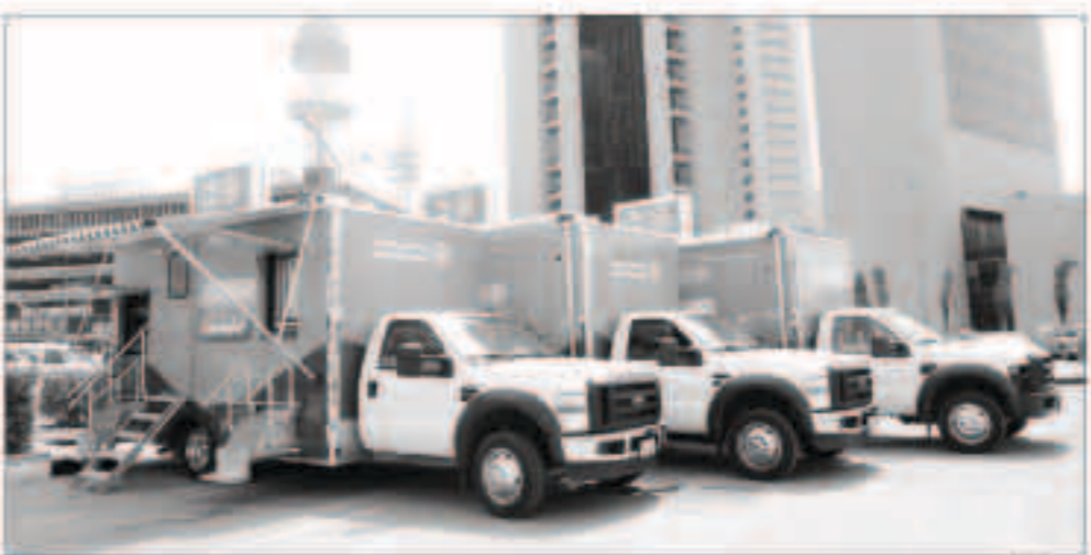
جهاز موبي بيك

الساعة لتلقي اتصالات العملاء والاستماع لظواهرهم والعمل على التجاوب معها بأسرع وقت ممكن. من خلال طاقم عمل مؤهل وتقنية متطورة تسهل مهامهم. كما يواصل «بيتك» تقديم الخدمة الهاتفية الآتية 1803333 التي تعمل على مدار الساعة. بدأت