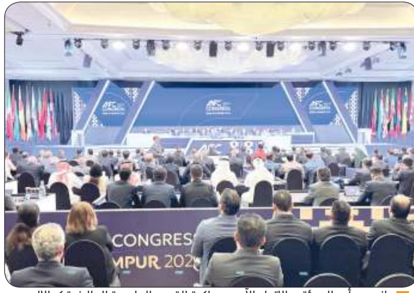
جانب من أعمال مؤتمر الاتحاد الآسيوي لكرة القدم بالعاصمة الماليزية كوالالمبور

وآقر الاجتماع ميزانتي 2025 و2026 واعتمد البيانات المالية المدققة لعام 2024 وتقرير مراجعي الحسابات إذ بلغت نفقات الاستثمار الكلية للاتحاد خلال عام 2024 نحو 303 ملايين دولار مسجلة زيادة بنسبة 63.9 بالمئة مقارنة بالعام السابق. وأعلن الاتحاد الآسيوي أمس الأول الجمعة تلقيه سبعة عروض رسمية لاستضافة نسخة 2031 من بطولة كأس آسيا من بينها ملف دولة الكويت ما يعكس الثقة المتزايدة من الاتحادات