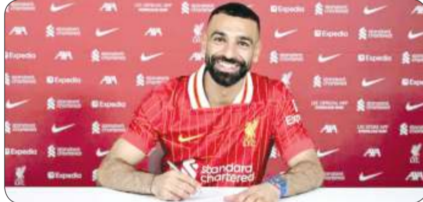
صلاح لحظة تمديد عقده

أنهى الدولي المصري محمد صلاح مسلسل الجدل حول مستقبله الكروي، بعد أن وضع القلم على عقود التمديد الجديدة رفقة ناديه ليفربول. يمتد عقد محمد صلاح الجديد مع «الريدز» حتى 2027، ليكمل بذلك «الفرعون» عقداً من الزمن في أنفيلد، حيث وقع للفرع في 2017. وحسب ما هو مسرب حول راتب النجم المصري وهداف ليفربول التاريخي، سيتقاضى «مو» 400 ألف جنيه إسترليني أسبوعياً، ما يصل إلى 42 مليوناً سنوياً. وهناك 6 لاعبين فقط يتقاضون رواتب أعلى من محمد صلاح بعد تجديد عقده مع ليفربول، وهم روبرت ليفاندوفسكي، وكيليان مبابي، وإيرلينغ هالاند، وهاري كين، وديفيد ألأبا، ودوشان فلاهوفيتش، ويعدهم محمد صلاح. ويحتل البولندي ليفاندوفسكي (37 عاماً) صدارة أعلى راتب في الدوريات الخمسة الكبرى مع ناديه برشلونة، حيث يحصل على 640.962 يورو (541.020 جنيه إسترليني) أسبوعياً. ويأتي كيليان مبابي نجم ريال مدريد ثانياً، إذ يحصل على 600.962 يورو (507.257