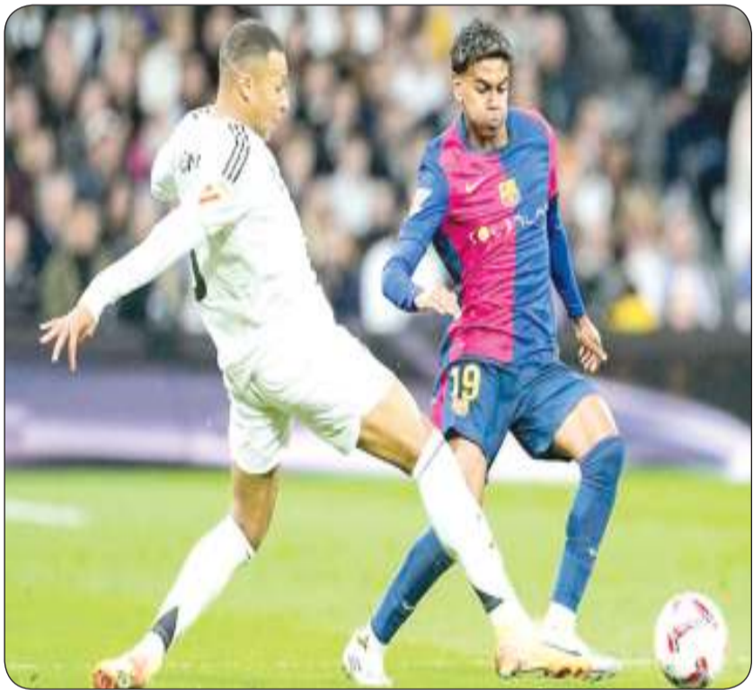
ريال مدريد وبرشلونة

وأكد الشيخ سلمان في كلمته أن الاتحاد شهد مرحلة استثنائية من التقدم منذ انعقاد الاجتماع السابق مشيراً إلى الزيادة الكبيرة في الاستثمارات الموجهة لدعم الاتحادات الأعضاء وتنظيم نسخة مميزة من بطولة كأس آسيا في قطر خلال عام 2024 إضافة إلى تنظيم 16 بطولة قارية مقارنته بـ 11 بطولة في عام 2023. وأضاف أن «إصلاحات