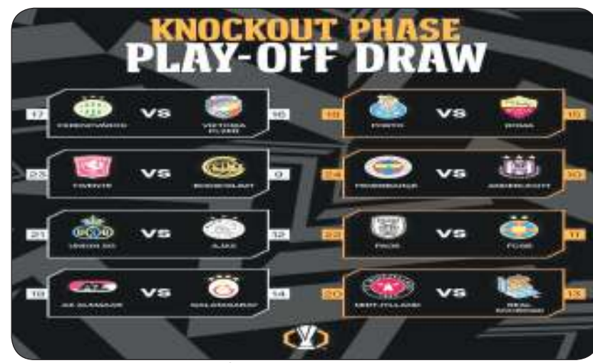
جدول ملحق الدوري الأوروبي

وأوقعت القرعة كذلك (الكمار) الهولندي في مواجهة (جالاتا سراي) التركي و(فريينسفاروتشي) الهنغاري في مواجهة (فيكتوريا بلزن) التشيكي. ومن المقرر أن تقام مباريات الذهاب في 13 فبراير فيما تقام مباريات الإياب في 20 من الشهر نفسه. يذكر أن نظام البطولة الجديد ينص على أن قرعة الملحق تأتي بعد مرحلة الدوري التي شهدت تأهل ثمانية فرق مباشرة إلى دور الـ 16 وهي (أتلتيك بيلباو) الإسباني و(آينتراخت فرانكفورت) الألماني و(لاتسيو) الإيطالي و(أولمبيك ليون) الفرنسي و(مانشستر يونايتد) الإنجليزي و(أولمبيكوس) اليوناني و(ريجنز) الإسكتلندي و(توتنهام هوتسبير) الإنجليزي.