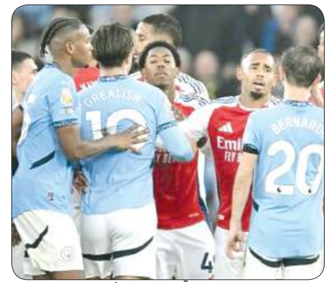
لقاء سابق بين آرسنال ومانشستر سيتي

يحل مانشستر سيتي اليوم الأحد ضيفاً تقيلاً على آرسنال في قمة الجولة 24 من الدوري الإنجليزي الممتاز. يستضيف إ استاد الإمارات، مواجهة من الغبار الثقيل بين بطل إنجلترا مانشستر سيتي ووصيفه آرسنال الموسم الماضي. يستعد السيتي لمواجهة تحد كبير في «الريميير ليغ» عندما يلح ضيفاً على «الغانرز»، وصيف ترتيب المسابقة برصيد 47 نقطة. ويأمل مانشستر سيتي إلى تحقيق الفوز والظفر بنقاط المباراة الثلاثة من أرض «المدفعية»، وأمام جماهيره، ومواصلة انتصاراته في المسابقة. وحقق «الأزرق السماوي» تحسناً ملحوظاً في أدائه مؤخراً، حيث تمكن من الفوز في أربع من أصل آخر خمس مباريات له في الدوري الإنجليزي.