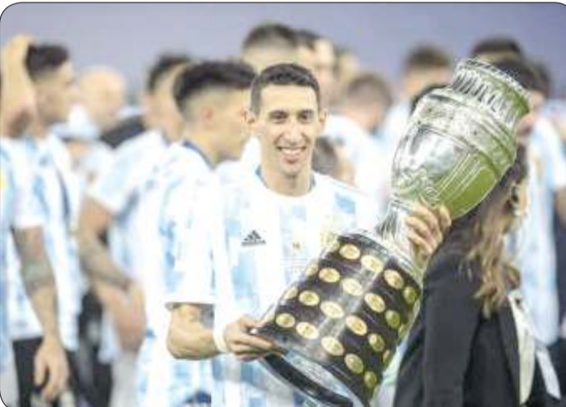
دي ماريا يحمل كأس البطولة

التواني: كوبا أميركا 2021، وفيناليسما 2022 وكأس العالم 2022 بقطر، وبطولة كوبا أميركا 2024. وكان دي ماريا، الذي ولد 14 فبراير 1988، يلعب دائما بتحقيق النجاح في كرة القدم الاحترافية، ولكن كل ما حققه مع المنتخب الأرجنتيني كان يصعب تخيله. وشارك دي ماريا للمرة الأولى مع المنتخب الأرجنتيني في 6 سبتمبر 2008 أمام باراجواي في مباراة بالتصفيات المؤهلة لمونديال 2010. وكانت تلك المباراة هي بداية مسيرة استثنائية تضمنت خوضه 154 مباراة دولية على مدار 16 عاما، ويعد دي ماريا ثالث أكثر لاعب مشاركة مع المنتخب الأرجنتيني خلف ليونيل ميسي (186) وخلف خافيير ماسيكرانو (147). وقال دي ماريا عن مسيرته: "لا يوجد أفضل من إنهاء مسيرتي بهذه الطريقة. ليس من السهل الوصول للمباريات النهائية والفوز بها. أعلم هذا لأنني خضت تجربة خسارة المباريات النهائية، والآن يحدث هذا: في مرحلة كان يجب أن يحدث هذا".