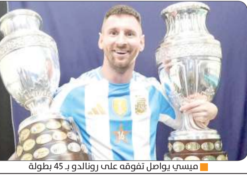
ميسي يواصل تفوقه على رونالدو بـ45 بطولة

وتواجد ميسي في القائمة الأساسية لمنتخب الأرجنتين خلال لقائه مع نظيره الكولومبي، في المباراة النهائية للمسابقة القارية، المقامة في الولايات المتحدة. وبات هذا هو النهائي الخامس لكوبا أميركا الذي يخوضه ميسي في مشواره الكروي، لينفرد بالرغم القياسي كأكثر اللاعبين خوضا للمباريات النهائية في تاريخ المسابقة الدولية الأقدم على مستوى المنتخبات في العالم، بعدما كان يتقاسمه مع مواطنه المعتزل خافيير ماسيكرانو، الذي شارك في 4 نهائيات. وكان ميسي قد شارك في المباريات النهائية لسنة 2007 و2015 و2016 و2021 و2024 بالبطولة. وأصبح هذا هو الرقم القياسي الثالث الذي يحققه ميسي في النسخة الحالية لكوبا أميركا، بعدما بات أكثر اللاعبين خوضا للمباريات في تاريخ المسابقة، برصيد 39 لقاء، كما بات ثاني لاعب يهز الشباك في 6 نسخ مختلفة بالبطولة. وكان ميسي قد أحرز هدفا خلال فوز الأرجنتين 2-0 على كندا بالدور قبل النهائي للبطولة، ليكسر إنجاز البرازيلي الراحل زينيثيو، الذي تمكن من التسجيل في 6 نسخ للبطولة