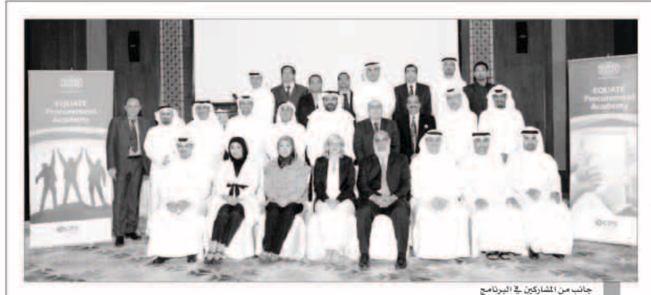
جانب من المشاركين في البرنامج

في دولة الكويت بل في مختلف أرجاء الخليج والشرق الأوسط... تمثل شركة إيكويت للبترولوكيماويات التي تأسست عام 1995 شركة عالمية بين شركة صناعة الكيماويات البترولية وشركة داو للكيماويات وشركة بوبيان للبترولوكيماويات وشركة القرن لصناعة الكيماويات البترولية. وبدأت شركة إيكويت عمليات الإنتاج في شهر نوفمبر من العام 1997، وهي حاليا المشغل الوحيد لجموعة متكاملة من المصانع ذات المواصفات العالمية التي تنتج أكثر من 5 ملايين طن سنويا من المواد البتروليةوكيماوية عالية الجودة التي يتم تسويقها في الشرق الأوسط وآسيا وأفريقيا وأوروبا.