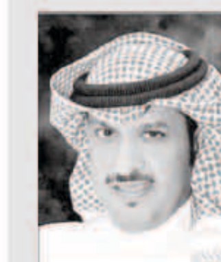
الشيخ طلال الخالد

«كونا»: أكد رئيس مجلس إدارة شركة ناقلات النفط الكويتية والعضو المنتدب للعلاقات الحكومية والبرلمانية والعلاقات العامة والإعلام في مؤسسة البترول الكويتية الشيخ طلال الخالد أن المؤسسة تسعى إلى ترسيخ مفاهيم المسؤولية الاجتماعية المستدامة.