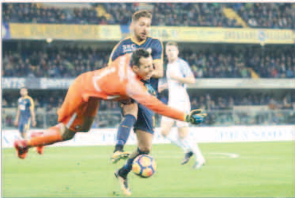
جانب من المباراة

الصحف الإيطالية، وقيل سياليني، خلال تصريحات أدلى بها بعد نهاية اللقاء لشبكة ميدياست «نحن نسير بخطى متيرة، نكافح للحصول على هذه النقاط». وتابع «الجميع يناقش على اللقب، لا يجب أن ننسى ميلان الذي سيعد قويا لأنه جاهز، هناك أيضا سامبدوريا الذي يؤدي بشكل جيد لأنه يمتلك مدري يعرف ما يفعله». وعن رايه في أداء الأندية الكبرى في الكالتشيو، علق سياليني «يوفنتوس الأفضل، لا أحد يلعب مثل نابولي، روما قوي للغاية، ولاتسيو يجب أن نحترس منه». وواصل حديثه قائلا «سليدا العمل سريعا، إذا لم نفعل ذلك، فإننا لن نصل للهدف الذي نريده هذا الموسم».