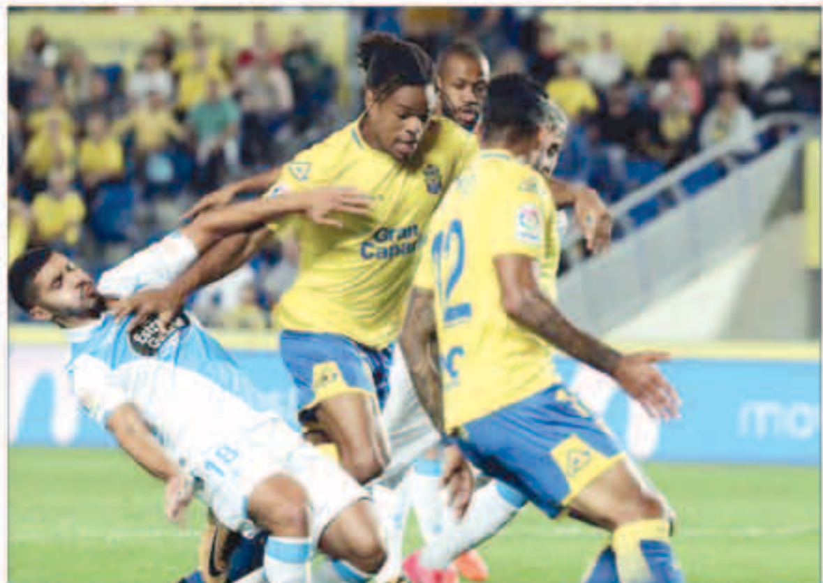
ديبورتيغو وللاس بالماس

ابتعد ديبورتيفو لأكورونيا خطوة عن منطقة الخطر، بالدوري الإسباني لكرة القدم، عبر الفوز على مضيفه لاس بالماس، 3-1، في المرحلة العاشرة من المسابقة. وفي مباراة أخرى بالمرحلة نفسها، فاز إسبانيول على ضيفه ريال بيتيس، 1-0. وعلى ملعب دي جران كاناريا، تقدم المهاجم الفرنسي، لويك ريمي، بهدف لفريق لاس بالماس، في الدقيقة الثامنة، ولكن لاعب الوسط الكوستاريكي، سيلسو بوجيس، رد بهدفين لديبورتيغو، في الدقيقتين 36 و54. وتكلت لوكاس بيريز مارتينيز، بتسجيل الهدف الثالث لديبورتيغو، من ضربة جزاء، في الدقيقة 69.