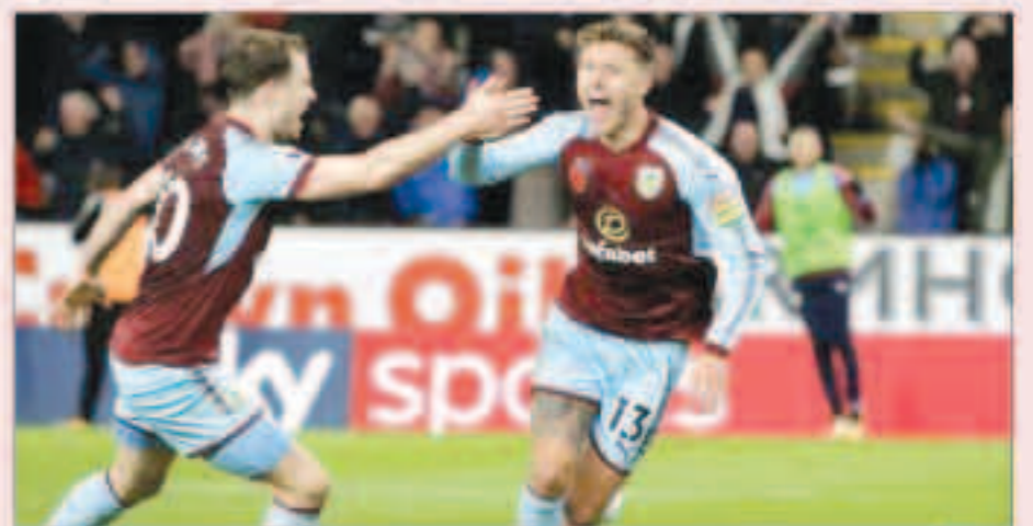
فرحة لاعبي بيرنلي

أحرز جيف هنديريك، هدفا في الدقيقة 74، ليمنح بيرنلي الفوز 1-0 على نيوكاسل يونايتد في الدوري الإنكليزي الممتاز لكرة القدم. وفي لقاء شهد القليل من الفرص، سدد جاك كورك، كرة ردها الحارس روب اليوت، وتابع يوهان بيرج جودموندسون الكرة وأرسلها عرضية ليحولها