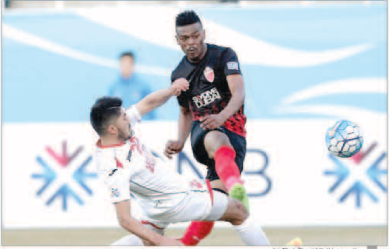
جانب من مباراة طقسند والأهلي الإماراتي