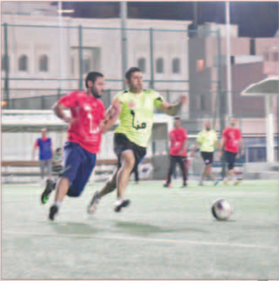
جانب من اللقاءات

المفاجأة لفريق المصراوية من محبي ابوتريكة بعد هبوط غير مبرر في مستوى أداء المصراوية بعكس مبارياته السابقة من البطولة. وتقام مباريات دور الـ 8 من البطولة يوم الخميس الموافق 21 إبريل على أن تقام مباريات دور الأربعة ( قبل النهائي) يوم الجمعة الموافق 22 من هذا الشهر وستكون مواجهات دور الـ 8 كالتالي: الأصدقاء - الاتحاد من القابضة - الأحلام رابطة أبناء النوبة - الفراعنة النجوم - سوكر وفي ذات البطولة نفسها إنتهت الجولة الأخيرة للبراعم بصعود 4 فرق للدور قبل النهائي وهم أكاديميات جولدن بوي والمصرية عن المجموعة الأولى وأكاديميات دريم والموهوبين عن المجموعة الثانية. تقام البطولة على ملاعب الهيئة العامة للرياضة بمنطقة السرة بالتعاون مع إدارة الرياضة للجمع ونحت رعاية شركة من القابضة وفن كويست.