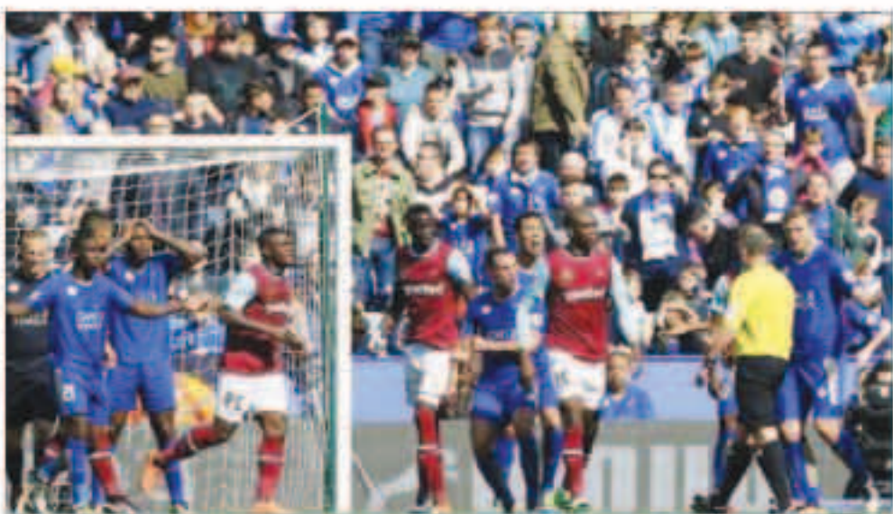
جانب من مباراة ليستر سيتي وست هام

من الأهداف في المسابقة هذا الموسم إلى 22 هدفاً بالتساوي في صدارة الأهداف مع حذاف توتنهام هاري كين، لكنه كلف فريقه غالبا بعد تعرضه لشطرد في الدقيقة 56، ليصبح وست هام هدفاً في الشوط الثاني عن طريق أندي كارول (84) من ركلة جزاء، وأرون كريستول (86)، ثم أحرز البديل ليوناردو أولوا هدف التعادل لليستر في الدقيقة الخامسة من الوقت الحسب بدلا عن ضائع من ركلة جزاء.