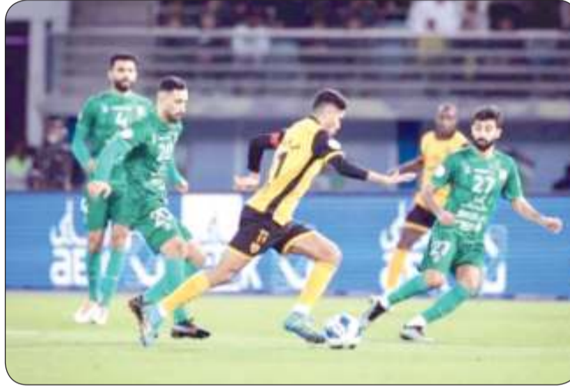
دربي خارج التوقعات

إلا أنه عانى من كثرة الإصابات. وجاءت إقالة داركو قبل مواجهة القادسية مباشرة، ضمن الجولة الثالثة من مجموعة البطولة (مرحلة التتويج) بالدوري الممتاز. وتجري مفاوضات مع أكثر من مدرب لا سيما السوري فراس