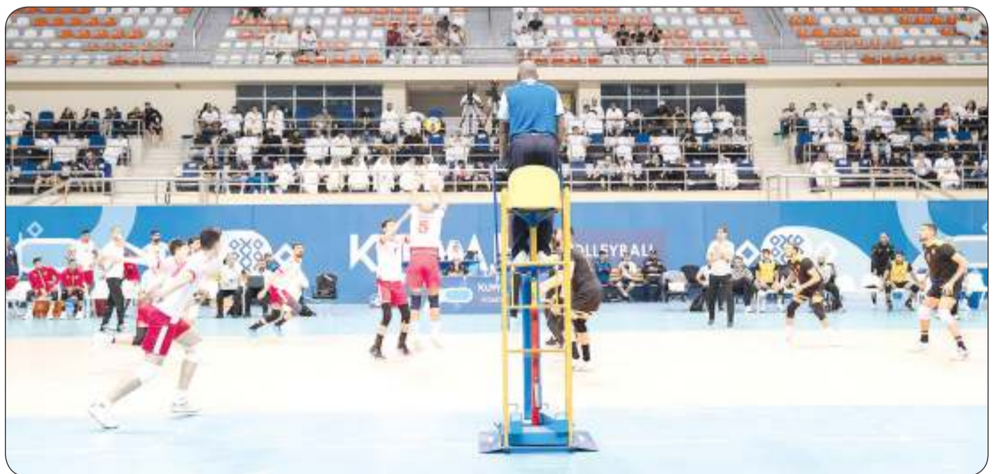
جانب من المباراة

يذكر أن القادسية حاز لقب البطولة منذ انطلاقتها 23 مرة ثم كاطمة 15 والكويت 13 في حين فاز العربي باللقب أربع مرات والجهراء مرة واحدة.