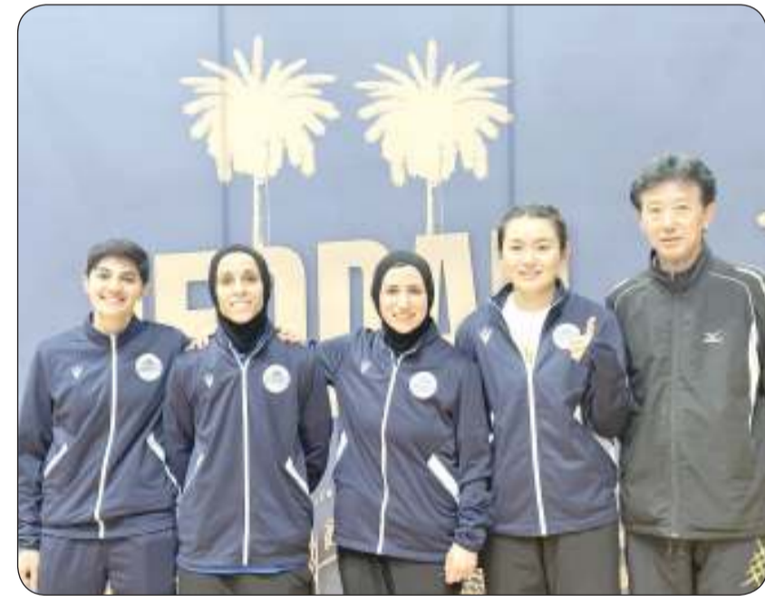
جماعية لفريق نادي الفتاة

وأكدت الحمد أهمية تحقيق مراكز متقدمة في البطولة الحالية ليحظى النادي بتصنيف أفضل في المشاركة بالبطولات المقبلة مشيرة الى أن مشاركة النادي في بطولة الاندية العربية الـ 34 لكرة الطاولة والتي اختتمت منافستها الخميس الماضي اعطت دافعا للذهاب بعيدا في البطولة الحالية.