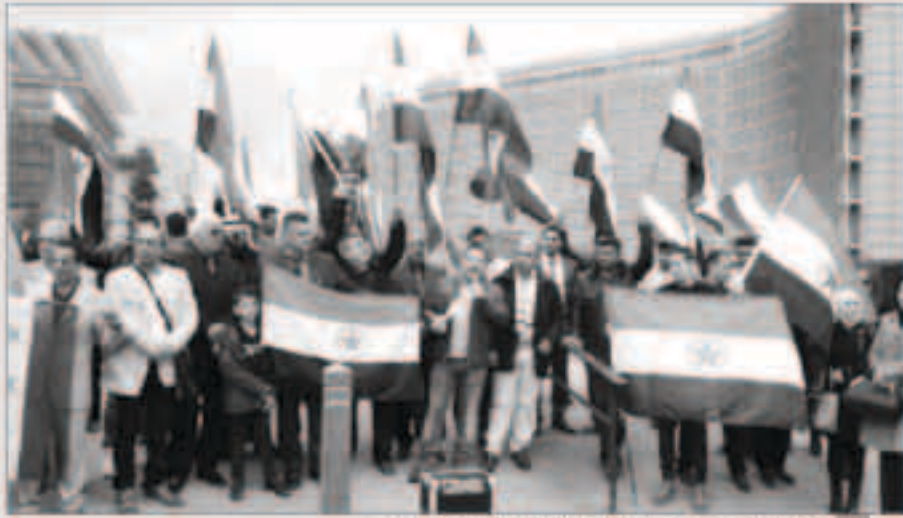
تظاهرون أهوازيون يتظاهرون أمام المفوضية الأوروبية في بروكسل

وأعربت الجبهة أيضاً عن تأييدها الكامل للموقف الإماراتي ومساعيها السلمية لاستعادة سيادتها كاملة غير متقوصة على الجزر المحتلة من قبل إيران.