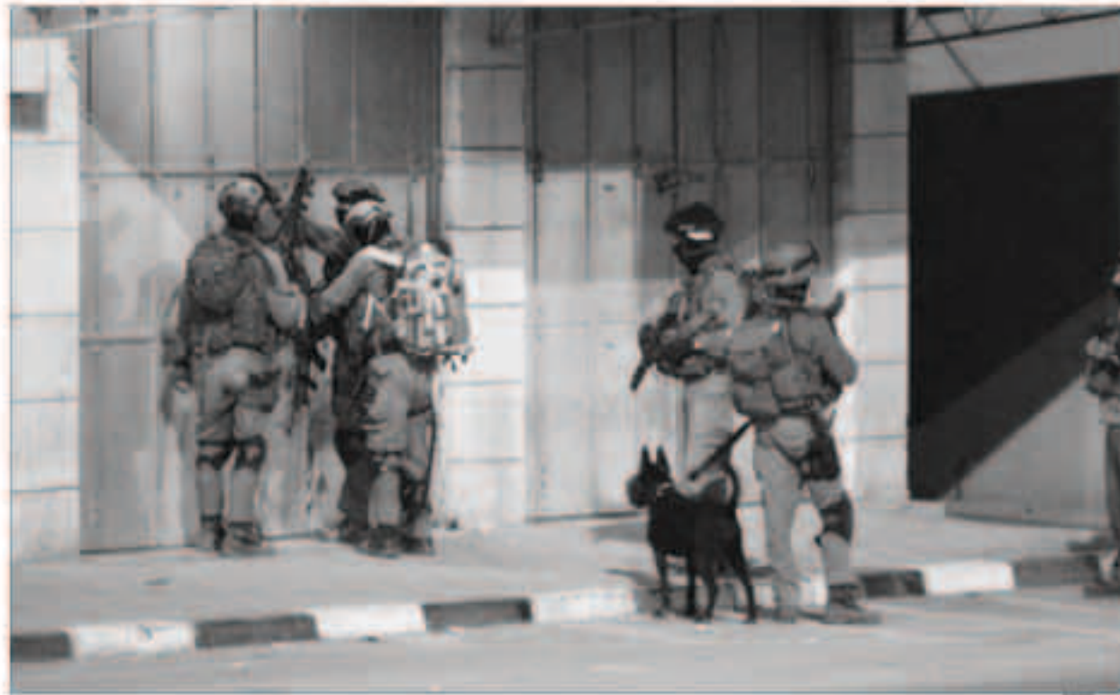
عناصر من جيش الاحتلال في الضفة