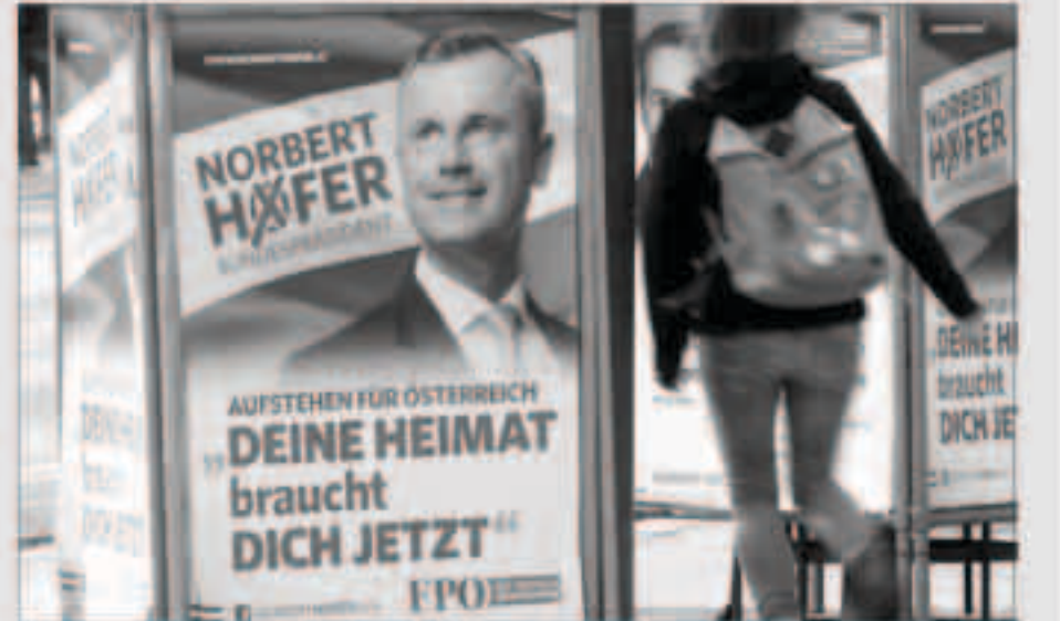
جانب من الحملة الانتخابية في النمسا

يبدلي ناخبو النمسا بأصواتهم، في الجولة الأولى من الانتخابات رئاسية يمكن أن تؤدي دوراً في وقف أو دفع تحول الدولة نحو اليمين، وتنتهي ولاية الرئيس هاينز فيشر الاشتراكي الديمقراطي في يوليو المقبل، وذلك بعد أن بقي 12 عاماً في السلطة.