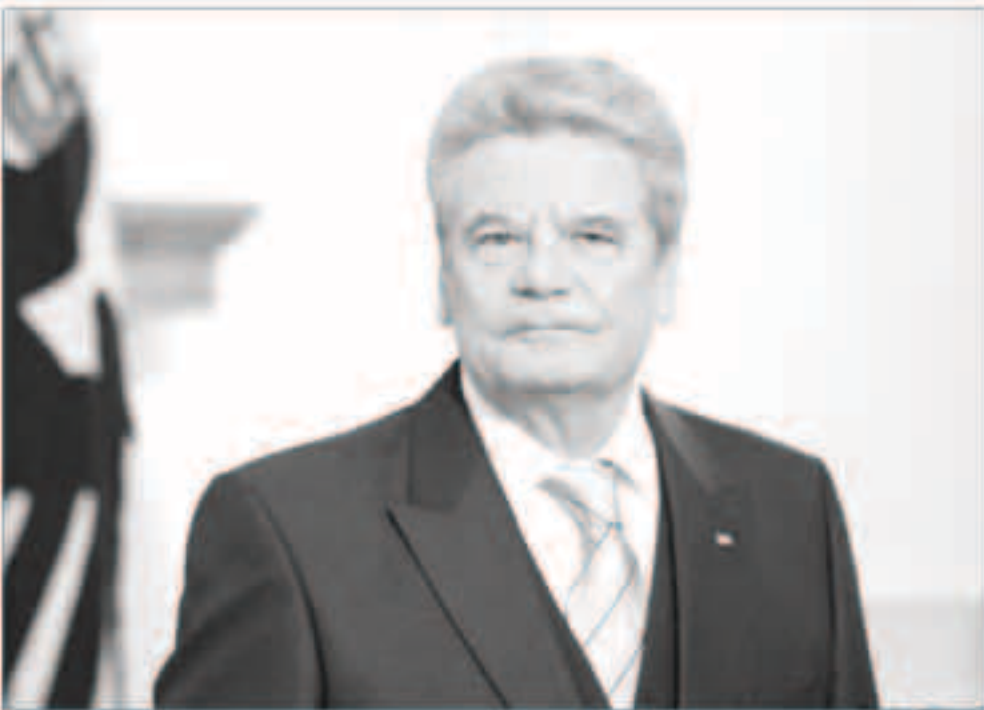
الرئيس الألماني يواخيم غاوك

برلين - «وكالات» : دافع الرئيس الألماني يواخيم غاوك، عن اتفاق اللجوء الذي تم التوصل إليه بين الاتحاد الأوروبي وتركيا، في مواجهة انتقاد نشطاء حقوق الإنسان.