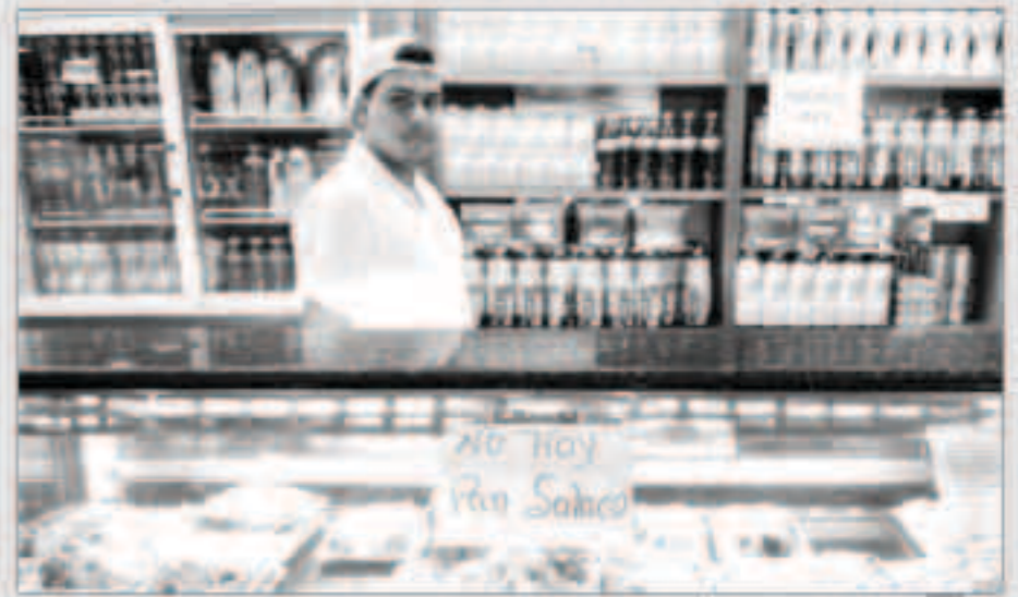
لافتة كتب عليها لا خبز في أحد محلات كراكاس

كراكاس - «وكالات» : في أحد المخازن بشرق كراكاس يمكن الحصول على زيت الزيتون الإسباني وصلصة الطماطم الإيطالية وبيضات مستوردة بأسعار مغفولة لكثير من الفنزويليين. لكن هناك امرا واحدا مؤكدا هو انه لا يوجد خبز.