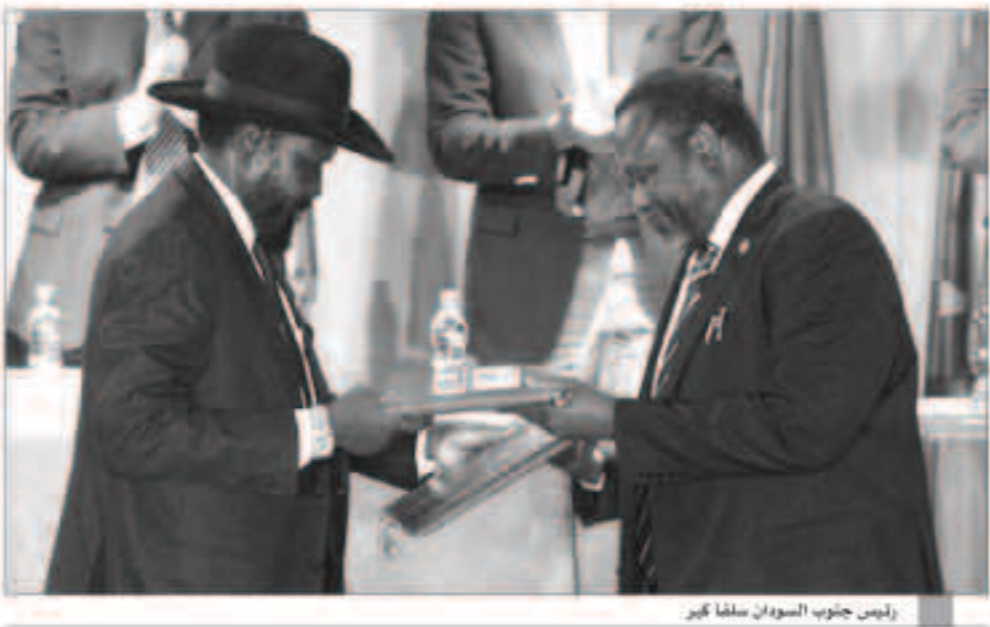
رئيس جنوب السودان سلفا كير

الأمم المتحدة - «وكالات» : قالت أنغولا يوم أمس الأول إنها اقترحت أن يفرض مجلس الأمن الدولي حظرا على تصدير السلاح لجنوب السودان حيث قتل أكثر من عشرة آلاف شخص خلال عامين من الحرب الأهلية التي أثارها خلاف سياسي بين زعماء هذا البلد. وقالت الأمم المتحدة الأسبوع الماضي إن الطرفين المتحاربين في جنوب السودان يقتلان ويضطغان ويشردان المدنيين ويدمران الممتلكات رغم الهدنة التصالحية نكل من الرئيس سلفا كير ونائبه السابق ريك مشار. وقال إسماعيل أيراب جاسبار سفير أنغولا لدى الأمم المتحدة إن «الوضع يتطور وعلينا العمل مع الوضع الواجب فعله الآن هو (فرض حظر على السلاح. لقد اقترحتنا واتعلم أن يؤيد الجميع ذلك، وأنغولا عضو منتخب لمجلس الأمن الدولي. وأيد مانوي ريكورفت سفير بريطانيا في الأمم المتحدة حظر السلاح المقترح. وقال «نصف السكان في حاجة لمساعدات إنسانية في جنوب السودان. من الواضح أنه رغم اتفاق السلام فإن استمرار القتال يرسخ بشكل أكبر الأزمة الإنسانية. هذا هو السبب في دعوة المملكة المتحدة لفرض حظر على السلاح الآن». وكانت روسيا التي تملك حق النقض (الفيتو) في مجلس الأمن قد قالت الشهر الماضي إنها تعارض فرض حظر على السلاح على جنوب السودان أو إبرام اسم كير وسلفا في قائمة سوداء لأن مثل هذه الخطوات لا تخدم تنفيذ اتفاق السلام الذي اتفق عليه الجانبان في أغسطس آب. وبعد أشهر من مفاوضات غير فعالة وأخفاق عمليات لوقف إطلاق النار اتفق الجانبان في يناير كانون الثاني على تقاسم المناصب في حكومة انتقالية وأعيد كير في وقت سابق من الشهر الجاري لمنصبه السابق نائبا للرئيس.