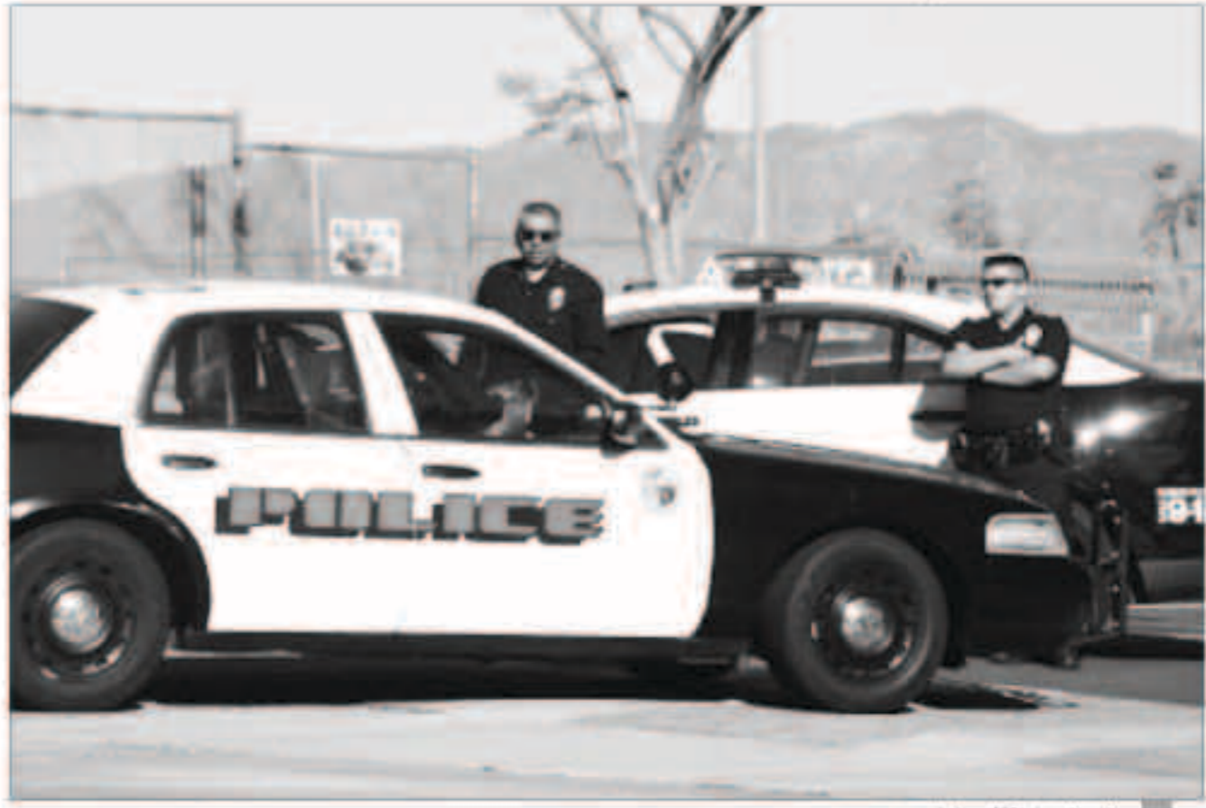
شخص من شرطة لوس انجليس

من جانب آخر قال مسؤولون في جامعة كاليفورنيا بيركلي أنهم حذروا 80 ألف شخص بينهم طلاب حاليون وسابقون ويأهون من هجوم عبر الإنترنت على نظام يقوم بتخزين الأثرن على نظامي وأرقام الحسابات المصرفية. وتأتي هذه الأنباء بعد أقل من أسبوع من دفع مستشفى ساوترن كاليفورنيا 17 ألف دولار بالعملة