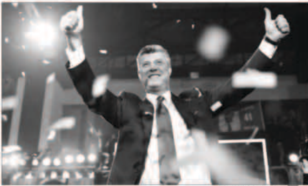
هاشم تاجي رئيساً لكوسوفو

بريشيتا - «وكالات» : انتخب وزير الخارجية ورئيس الوزراء السابق هاشم تاجي رئيساً جديداً لكوسوفو أمس الأول، بعد يوم متوتر شابته احتجاجات داخل البرلمان وفي الشوارع. وقالت لجنة الانتخابات، تعلن انتخاب هاشم تاجي رئيساً لجمهورية كوسوفو لمدة خمس سنوات، موضحة أن 81 من نواب البرلمان المكون من 120 شاركوا في الجولة الثالثة من الانتخابات، وصوت 71 منهم لتاجي. وكان التصويت قد بدأ بعد إقدام نواب المعارضة المصممين على تخريب التصويت وفرض انتخابات مبكرة على إطلاق الغاز المدعم في المجلس، رغم الحراسة المشددة عند دخولهم، حسب بيان اللجنة. وعندئذ تم إخراج عدد من نواب المعارضة بالقوة ومنعوا من التصويت في حين رفض الآخرون المشاركة، وذلك بالموازاة مع تجمع حوالي ألف من مناصريهم في الشارع رفضاً لانتخاب تاجي. واطلقت قوة مكافحة الشغب الغاز المدعم لتفريق متظاهرين التقوا قنصل حارث. وكانت أحزاب معارضة ترغبت في أن يوقف البرلمان التصويت احتجاجاً على دور تاجي في إبرام اتفاق مع صربيا يمنح مزيداً من الاستقلالية للأقلية الصربية في كوسوفو. وعجز تاجي (47 عاماً) عن الحصول على دعم ثلثي النواب المطلوب في دورتي الانتخاب الأولتين، بينما تطلبت الدورة الثالثة أكثرية بسيطة. وبعد التصويت شكر تاجي كل الجهات على الساحة السياسية، متعهداً ببناء كوسوفو جديدة، كوسوفو أوروبية، وتعميق علاقاتنا مع الولايات المتحدة.