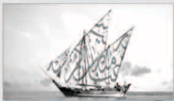
بحافة تهامة بنك الخليج

أعلن بنك الخليج عن إغلاق الفرع الرئيسي وجميع الأفرع الأخرى خلال عيد الأضحى المبارك وذلك ابتداءً من يوم الإثنين 14 أكتوبر حتى يوم الخميس 17 أكتوبر، على أن يستأنف البنك نشاطه وفقاً لساعات العمل المعتادة اعتباراً من يوم الأحد الموافق 20 أكتوبر 2013. هذا وباستطاعة جمع العملاء مواصلة التمتع بجميع خدمات بنك الخليج المعتادة أثناء العطلة وعلى مدار الساعة من خلال الاتصال على مركز خدمة العملاء على الرقم 1805805، حيث يتواجد موظفو بنك الخليج على مدار 24 ساعة يومياً لمساعدة العملاء مباشرة، كما بإمكانهم أيضاً زيارة الموقع الإلكتروني لبنك الخليج على العنوان التالي: www.e-gulfbank.com للحصول على المزيد من