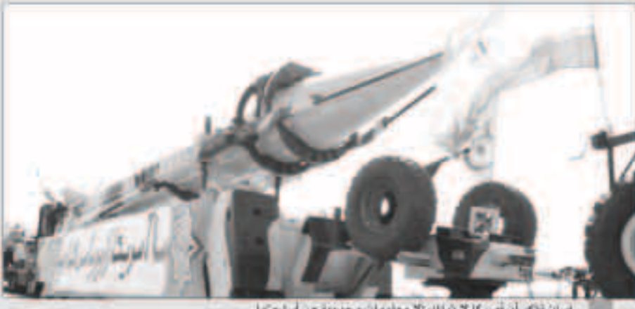
إيران تؤكد أن أميركا لا تفهم إلا معلومات محدودة عن أسلحتها

طهران - وكالات: قال المتحدث باسم القوات المسلحة الإيرانية العميد مسعود جزائري، إن معلومات الأميركيين عن قدرات طهران، العسكرية المتقدمة منها والمتطورة، «محدودة جداً». ونقلت وكالة الأنباء الإيرانية (إرنا) عن جزائري قوله أمس الإثنين: «يمكن الاستخلاص من مجموع الأخبار والمعلومات التي تنتشرها الأجهزة