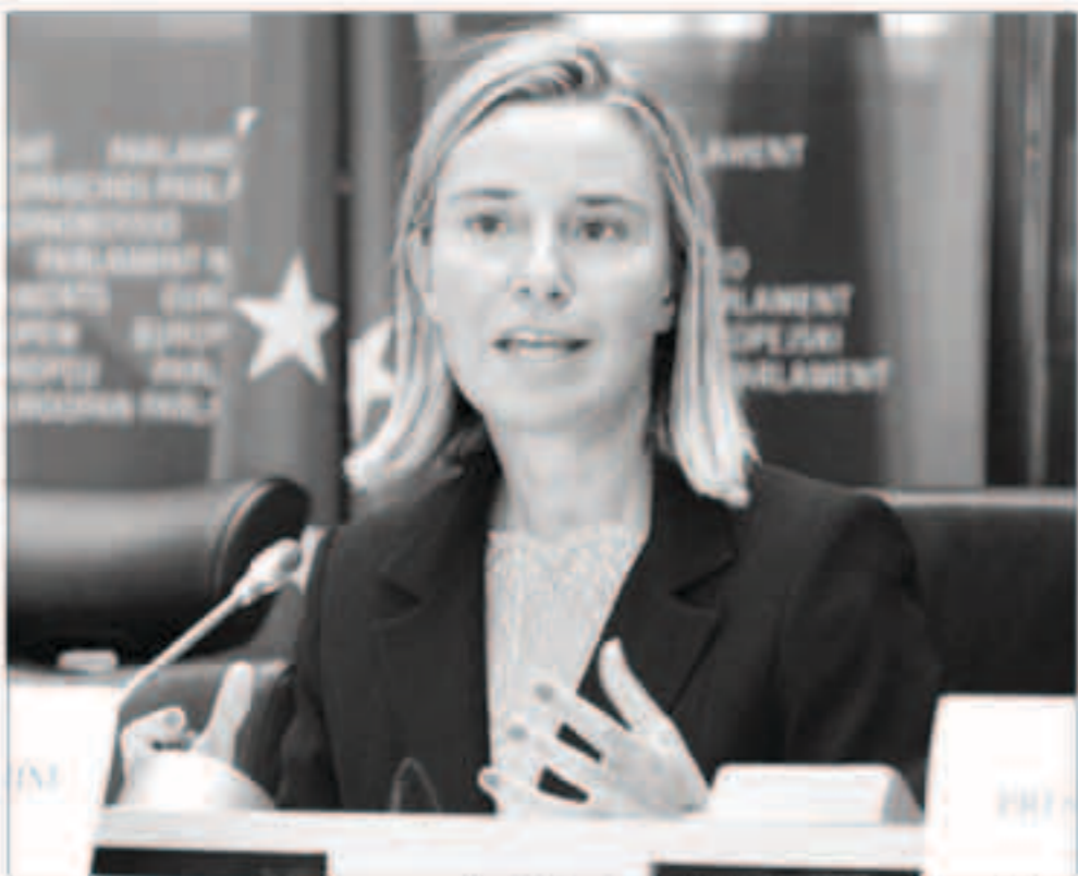
مسؤولة السياسة الخارجية في الاتحاد الأوروبي فيديريكا موغريني

الإنترنت، على أن وضع الأزمة الذي تعيشها فنزويلا «يلحق كثيراً» الاتحاد الأوروبي. كما أنه «يؤثر كثيراً» ليس فقط على الفنزويليين، بل أيضاً على المواطنين الأوروبيين. وفي تصريحات صحافية لدى وصولها لاجتماع مجلس وزراء خارجية بلدان الاتحاد الأوروبي، قالت موغريني: «اعتقد أننا سنتلقى نتائج حول الوضع في فنزويلا التي يلقينا وضعها كثيراً». ووفقاً لمصادر من التكتل الأوروبي، سيطلب الوزراء في ختام اجتماعاتهم من كافة الأطراف المعنية وقف أعمال العنف واحترام حقوق الإنسان. كما سيتم بحث سلطات فنزويلا على إطلاق سراح المعارضين السياسيين المسجونين والدعوة لانتخابات.