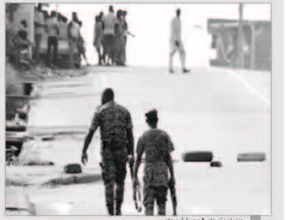
جنديان متقدمين في محيط أبيدجان

أبيدجان - وكالات: أكد سكان محليون في أبيدجان إطلاق النار بكثافة في مدينة سان بيدرو، ثاني مدينة ساحلية في كوت ديفوار الإثنين. مع انتشار تمرد عسكري مستمر منذ أربعة أيام. رغم إعلان الحكومة عملية عسكرية لاستعادة النظام. وقال أحد مصدري الكاكو في المدينة «الفردون في سان بيدرو، إنهم في كل مكان، هناك إطلاق نار كثيف، الجميع يقتلون المناجر وينوجهون إلى منازلهم. وأكد ثلاثة سكان آخرون إطلاق النار بالمدينة.