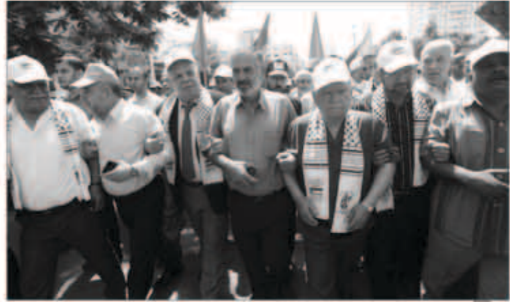
جانب من المسيرة التي نظمها فصائل المقاومة الفلسطينية في غزة

غزة - «وكالات»: نظمت القوى الوطنية والإسلامية في قطاع غزة، أمس الأحد، مسيرة في وسط مدينة غزة، إحياء للذكرى الـ 68 للنكبة الفلسطينية، والتي تزامن مع ذكرى قيام دولة إسرائيل.