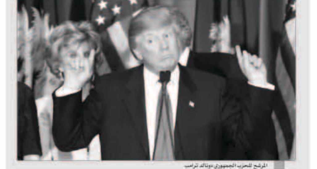
المرشح للحزب الجمهوري دونالد ترامب

واشنطن - «وكالات»: قال المرشح المفترض للحزب الجمهوري، دونالد ترامب في انتخابات الرئاسة الأمريكية خلال مقطع من مقابلة مع شبكة «بي بي سي» في «بي بي سي» إن انسحاب بريطانيا من الاتحاد الأوروبي لن يمس باي اتفاقات تجارية موقعة في حالة توليه منصب الرئيس.