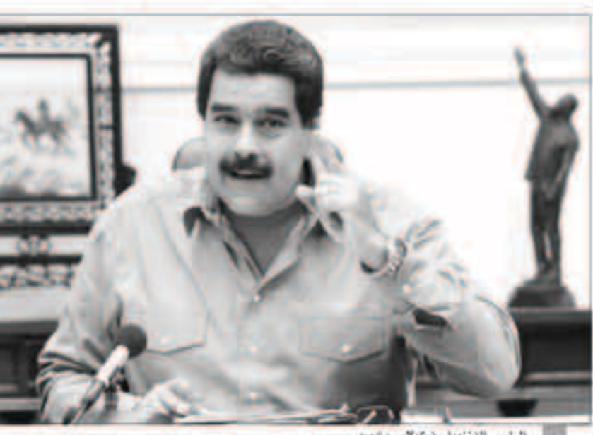
الرئيس الفنزويلي نيكولاس مادورو

وأطلق جنود الغاز المسيل للدموع على محتجين من رماة الاحتراف الأربعة الماضية في الوقت الذي قامت فيه المعارضة الفنزويلية بمسيرة للضغط على السلطات الانتخابية للسماع بإجراء استفتاء ضد مادورو.