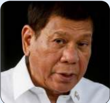
الرئيس السابق رودريغو دوتيرتي

ويحسب بيان الرئاسة الفلبينية فإن «الرئيس السابق ومجموعته يتمتعون بصحة جيدة ويخضعون لفحص من قبل أطباء الحكومة».