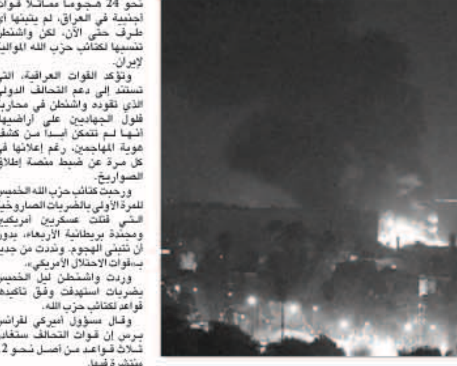
انفجار في المنطقة الخضراء في العراق

بغداد - وكالات - أعلنت 4 كتل شيعية في البرلمان العراقي رفضها لقرار الرئيس العراقي برهم صالح بتكليف عدنان الزرفي بتشكيل الحكومة الجديدة.