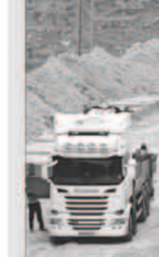
البنات تعمل على فتح الطريق الاستيطان

الغضبية الفلسطينية، وتشكلت المباحثات مع حوامة حلقة جديدة في إطار المشاورات التي كثفتها مع الفصل الفلسطينية لدفع ملف إنهاء الانقسام الفلسطيني.