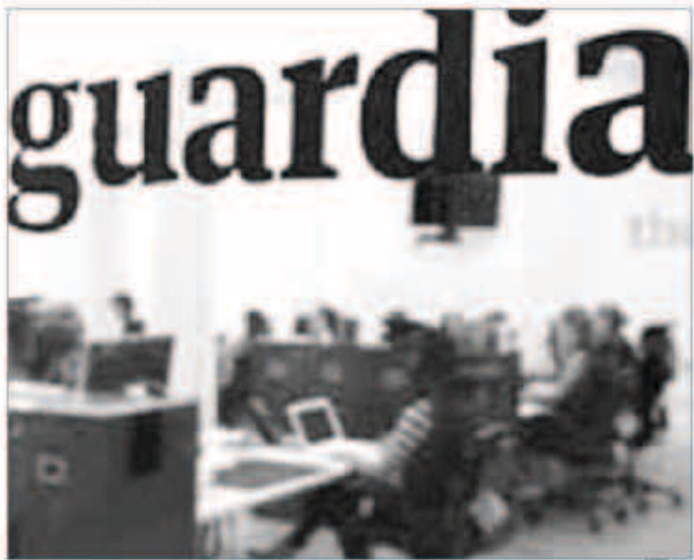
مصر تطالب صحيفة «الغارديان» بنشر اعتذار عن تقريرها الحافل بالأخطاء المهنية

القاهرة - وكالات - أعلنت الهيئة العامة للاستعلامات بالقاهرة، سحب اعتماد مراسلة صحيفة «الغارديان» في مصر، مع كل ما يترتب على ذلك من آثار تقوم بها الجهات المختصة.