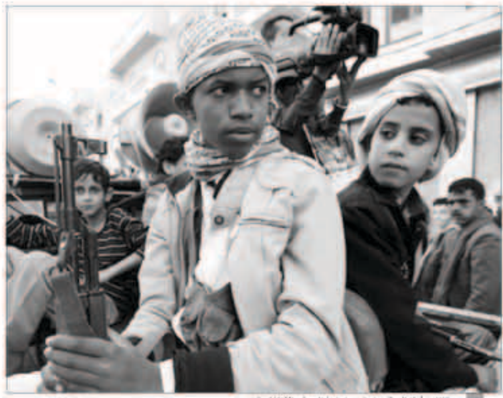
مقاتلون أطفال في صفوف ميليشيا الحوثي الانقلابية

عدن - وكالات : اعترضت قوات الدفاع الجوي السعودية، مساء الإثنين، صاروخاً بالستيا أطلقته الميليشيات الحوثية المدعومة من إيران من داخل الأراضي اليمنية باتجاه أراضي المملكة. وبحسب ما نقلته قناة «الإخبارية» السعودية فإن الصاروخ كان يستهدف منطقة نجران جنوبي المملكة، وتمكنت قوات الدفاع الجوي من اعتراضه وتدميره. كانت جماعة الحوثية، أعلنت إطلاق صاروخ بالستيا باتجاه منطقة نجران. وقالت قناة المسيرة الفضائية الناطقة باسم الحوثيين، إن القوة الصاروخية (التابعة للجماعة) أطلقت صاروخاً بالستيا نوع (بردا) على كهراب نجران العام من ناحية أخرى أفاد الجيش اليمني الرئيس عبده منصور شادي بسقوط قتلى وجرحى من مسلحي جماعة ميليشيا الحوثي الثلاثة في غارات جوية شنتها مقاتلات التحالف العربي، الذي تقوده المملكة العربية السعودية، في محافظة البيضاء وسط اليمن. وقال مصدر عسكري في الجيش اليمني إن «طيران التحالف شن عدة غارات جوية على مواقع وتجمعات مسلحي ميليشيا الحوثي، في مديرية الملاجم، محافظة البيضاء، ما أسفر عن سقوط قتلى وجرحى في صفوفهم، بالإضافة إلى تدمير البنية التحتية». وأضاف أن الغارات الجوية، تزامنت مع مواجهات بين قوات الجيش المدعومة بعناصر من المقاومة الشعبية من جهة، ومسلحي الميليشيا من جانب آخر،