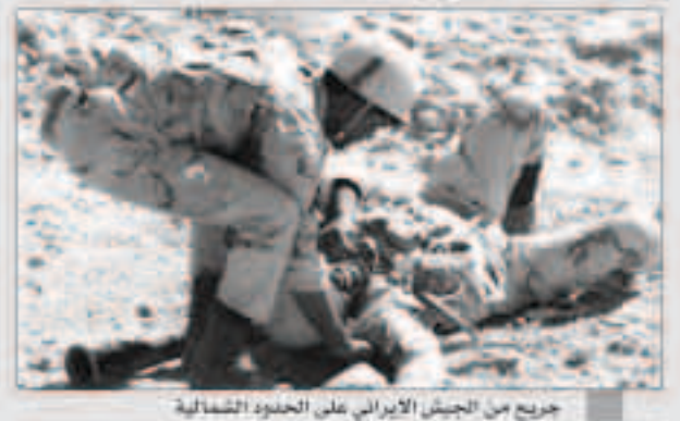
جريح من الجيش الإيراني على الحدود الشمالية

طهران - وكالات : أعلن مساعد قائد حرس الحدود في محافظة سيستان وبلوشستان، شرقي إيران، مقتل 2 من قوات حرس الحدود صباح الثلاثاء خلال اشتباكات اندلعت مع مسلحين في منطقة ميرجاوه الحدودية. ونقلت وكالة أنباء الجمهورية الإسلامية الإيرانية إرسا عن أبو الحسن ضيائي القول إن «الاشتباكات وقعت في ساعة مبكرة من صباح أمس، وإن قوات حرس الحدود صدقت للمسلحين بكامل قوتها». وأضاف أن «الذين من قوات حرس الحدود لقيوا حتفهم خلال الاشتباكات». وتقع ميرجاوه على بعد 75 كيلومتراً شرق زاهدان عند الحدود المشتركة مع باكستان. تجدر الإشارة إلى أن «سيستان وبلوشستان» متاخمة للحدود مع أفغانستان وباكستان وتملك معها حدوداً تمتد لأكثر من 1000 كيلومتر.