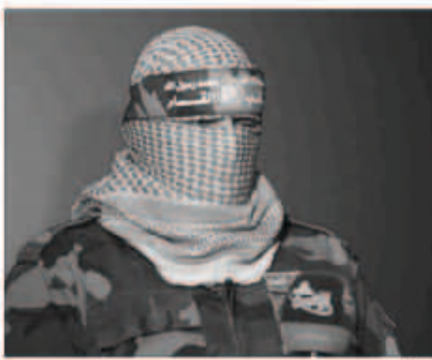
الناطق باسم الجناح العسكري لحركة حماس

ببذل أقصى جهد ممكن وتفعيل كل وسائل الضغط على حكومة الاحتلال لاحترام حقوق الأسرى التي كفلتها لهم المواثيق الدولية والإنسانية، وعلى رأسها اتفاقية جنيف الرابعة والإعلان العالمي لحقوق الإنسان. وتعترف كتابت السام الجناح العسكري لحركة حماس باسر 4 إسرائيلييين، بينهم جنديان أسرا خلال عمليات عسكرية خلال الحرب الإسرائيلية على غزة صيف العام 2014، فيما أسرت جندياً آخر في ظروف غامضة لم تعلن عنها. من جهة أخرى اعتقلت قوات الاحتلال الإسرائيلي، أمس الثلاثاء، 13 فلسطينياً في مناطق متفرقة من الضفة الغربية المحتلة. وبين شادي الأسير، في بيان، بحسب وكالة «وفا»، أن 5 فلسطينيين جرى اعتقالهم من بلدة عزون شرق قلقيلية، والذين أحرار في محافظة جنين، وآخر من نابلس. كذلك جرى اعتقال 3 فلسطينيين من مخيم الأعرجي في محافظة رام الله والبيرة، واعتقل الاحتلال فلسطينياً في كل من محافظة بيت لحم ومحافظة طوباس. يذكر أن الاحتلال الإسرائيلي يعتقل بشكل شبه يومي فلسطينيين يصغهم بانهم مطلوبون لأجهزته الأمنية، على حد زعمه.