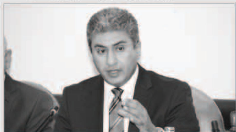
وزير الطيران المدني المصري شريف فتحي

القاهرة - وكالات : كشف وزير الطيران المدني المصري شريف فتحي، عقد اجتماع تنسيقي مع الجانب الروسي في منتصف مايو المقبل لتحديد خارطة الطريق المستقبلية لعودة رحلات الطيران إلى شرم الشيخ والغردقة. وقال فتحي، في تصريحات صحافية أمس الثلاثاء، على هامش مؤتمر «أفريقيا للطيران 2018» في القاهرة: «ستقيم في الاجتماع المرتقب، مرحلة تسيير الرحلات بين الجانبين، بعد استئناف الرحلات التي كانت متوقفة منذ أكثر من عامين، على خلفية حادث الطائرة الروسية المتكوية فوق شمال سيناء، ونحن نحترم قرارات الجانب الروسي».