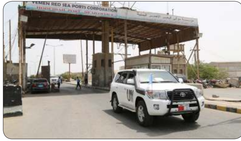
بعثة الأمم المتحدة في اليمن

ثمانية موظفين إضافيين من الأمم المتحدة، من بينهم ستة يعملون في محافظة صنعاء، مما أثر على قدرة الوكالات الأممية على العمل.