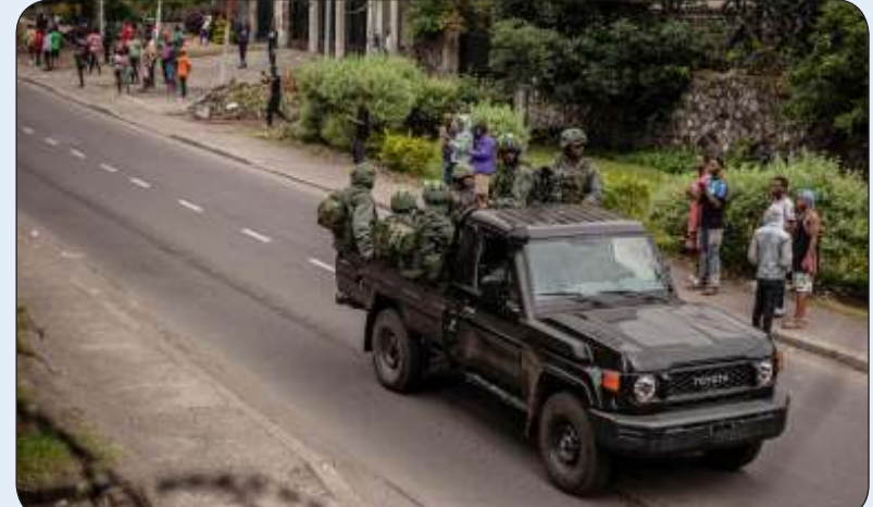
العديد من النازحين أعربوا عن مخاوفهم من العودة لديارهم

من جانبها، تقول الحركة المتمردة 23 دعاة للنازحين تاتي في إطار جهودها لإعادة الحياة الطبيعية إلى المناطق التي تسيطر عليها، وتشدد على أنها ملتزمة بضممان أمن العائدين.