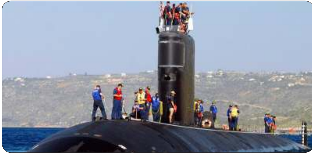
الغواصة الهجومية الأمريكية يو إس إس ألكسندريا

كما أشار المتحدث إلى أن «القوات المسلحة لكوريا الشمالية ستقوم بأعمال ردع العوامل التي تهدد بيئة الأمن الإقليمي، ولن تردد في ممارسة حقها المشروع في معاينة المستقنين».