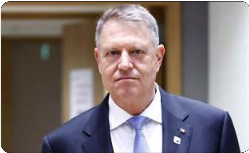
رئيس رومانيا كلاوس يوهانيس قال إنه سيقب في منصبه حتى انتخاب خليفة له

القرار «انقلاب رسمي». وستجري الآن دورة أولى من الانتخابات الرئاسية يوم الرابع من مايو وثانية يوم 18 مايو إذا لم يحصل أي مرشح في الدورة الأولى على أكثر من 50 في المئة من الأصوات.