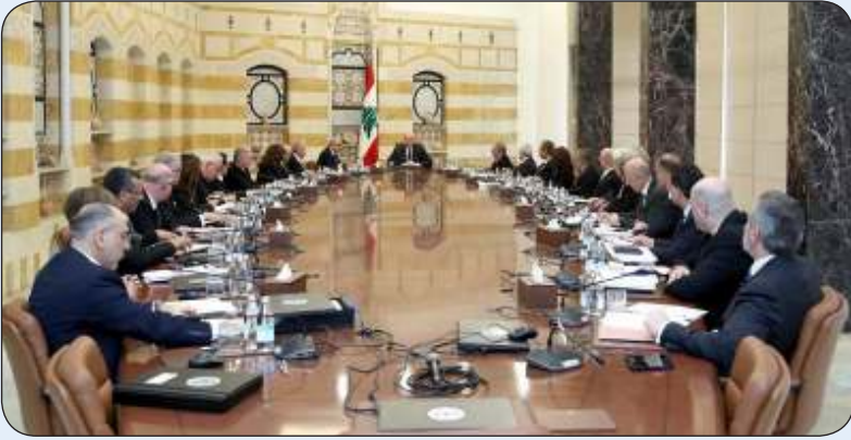
من اجتماع الحكومة اللبنانية الجديدة برئاسة عون

«وكالات»: عقد مجلس الوزراء اللبناني، أمس الثلاثاء، أولى جلساته في القصر الجمهوري في بعدا، شمال شرق بيروت، برئاسة رئيس الجمهورية جوزيف عون، وحضور رئيس الحكومة نواف سلام والوزراء.