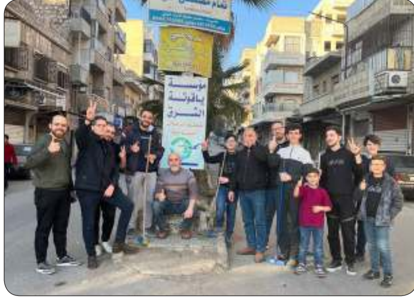
من مدينة حماة