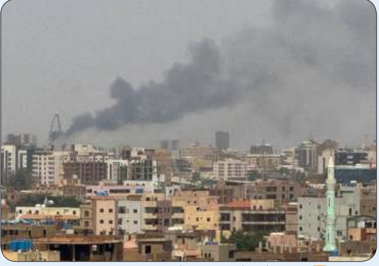
الخرطوم تشهد اشتباكات بين الجيش السوداني وقوات الدعم السريع

الجيش من مواقعه شمال المدينة الوصول إلى سلاح الإشارة أقصى جنوب الخرطوم بحري، ومنها إلى مقر القيادة العامة للجيش المحاصر وسط الخرطوم. وقال من جهته، قال مؤتمر الجزيرة، وهو هيئة معنية برصد انتهاكات الدعم السريع بولاية الجزيرة، إن قوات الدعم السريع قتلت 20 مدنيا بقرية الخيران. وعلى صعيد آخر، قالت مصادر للجزيرة إن مسيرات الدعم السريع استهدفت محطة كهرباء الشوك شمال مدينة القضايف فجر السبت، مما أدى إلى خروج المحطة عن العمل، وانقطاع الكهرباء في كل من ولايتي الخرطوم وكسلا وشرقي السودان. وفي بيان سابق، قالت قوات الدعم السريع إن قواتها دكت ودمرت، السبت، القوات المتحالفة مع الجيش في مناطق الحلف، ودريشقي، وماو بولاية شمال دارفور، حسب تعبيرها. وذكرت قوات الدعم السريع أن قواتها فرضت السيطرة الكاملة على تلك المناطق، وكبدت الحركات المتحالفة مع الجيش خسائر كبيرة في الأفراد والمعدات، واستولت على 206 سيارات قتالية، وأحرقت 67 منها في المعركة، طبقا للبيان.