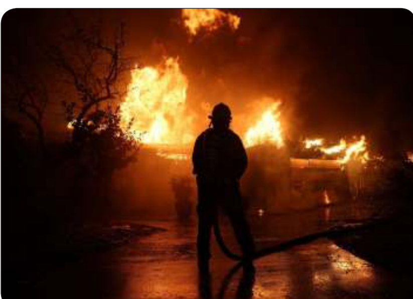
رجل إطفاء خلال محاولته وقف توسع الحرائق في سفوح التلال شرقي لوس أنجلوس

حريقين هائلين أربعا لوس أنجلوس طوال 8 أيام. وارتفعت نسبة محاصرة الحرائق في منطقة «بالساديس» غرب المدينة إلى 19 في المئة، بينما بلغت نسبة السيطرة على حريق «إيتون» في سفوح التلال شرق المدينة 45 في المئة. واندلع حريق جديد الأربعاء في مقاطعة «سان برناردينو» شرق لوس أنجلوس، مما أدى إلى حرق 30 فدانا (نحو 12 هكتار)، وفقا لتقارير إدارة الإطفاء في كاليفورنيا. كما تمت السيطرة بشكل شبه كلي على حريقين آخرين في جنوب كاليفورنيا.