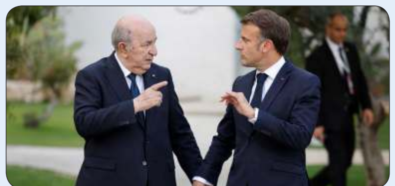
الرئيس الفرنسي إيمانويل ماكرون وتظيره الجزائري عبد المجيد تبون

من فرنسا وإليها، في تحد شفهي، رغم أنها لم ترض قدما في ذلك نظرا لطبيعة العلاقات التجارية الواسعة بين البلدين.