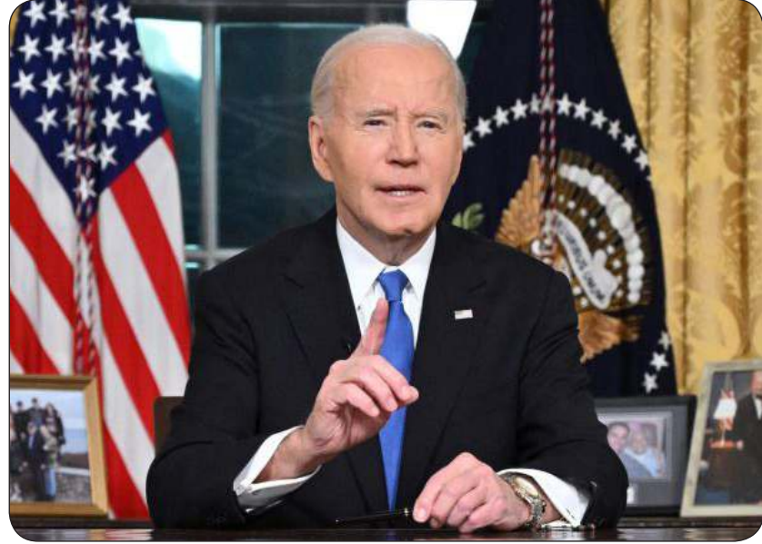
بايدن أعرب عن قلقه إزاء جمع السلطة والثروة لدى زمرة قليلة من الأثرياء

«وكالات»: هاجم مرشح الرئيس الأمريكي المنتخب دونالد ترامب لمنصب وزير الخارجية ماركو روبيو الزعيم الكوري الشمالي كيم جونج أون، ووصفه بالديكتاتور، كما اعتبر أن كوبا مكانها هو قائمة الدول الداعمة للإرهاب، وذلك بعد يوم من إعلان إدارة الرئيس الأمريكي المنتهية ولايته جو بايدن رفع كوبا من قائمة الدول الراحبة للإرهاب.