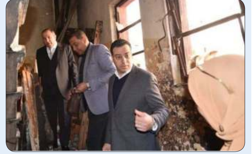
محافظ بورسعيد خلال تفقده مدرسة بورسعيد الثانوية بنات

متخصص للتأكد من تأمين الأسلاك الكهربائية، وأثناء دخول المحافظ لتابعة الموقع، تعرض هو وحارسه الشخصي لصعق كهربائي.