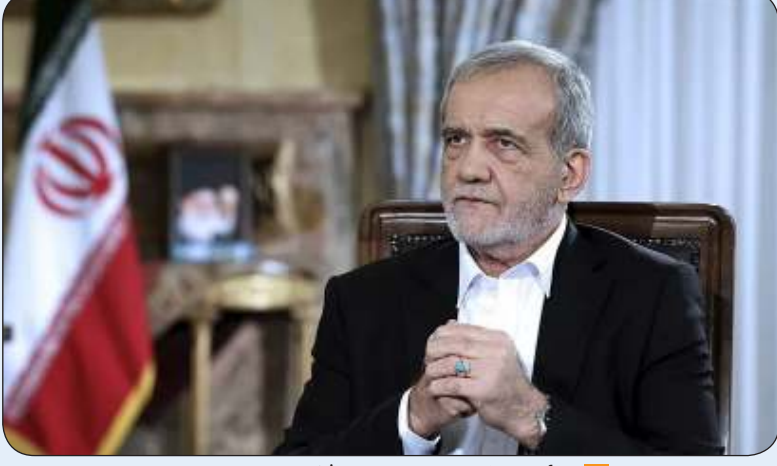
الرئيس الإيراني مسعود بزشكيان في الدوحة

يضعن الحجاب بشكل غير صحيح في الأماكن العامة أو على شبكات التواصل الاجتماعي، قد تصل في حال تكرار المخالفة إلى دفع ما يعادل 20 ضعف الراتب المتوسط، وفق ما ذكرت وسائل إعلام. ولم تنشر السلطات النص رسمياً.