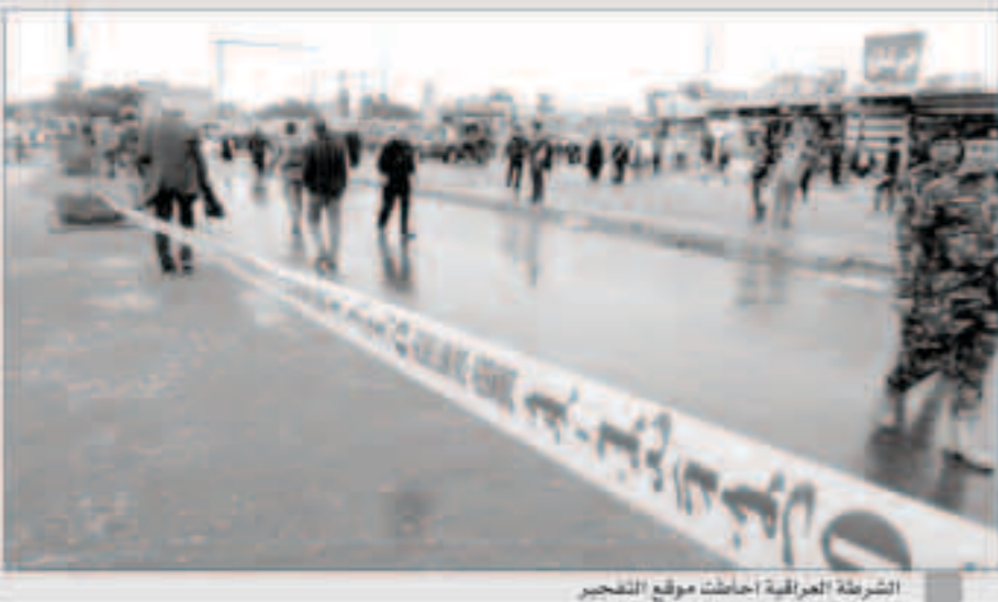
الشرطة العراقية أحاطت موقع التفجير

التفجير. إلا أن العديد من التفجيرات التي تشهدها بغداد بشكل دوري، وخصوصاً تلك التي تستهدف مناطق ذات غالبية شعبية، يتبعها تنقل الدولة الإسلامية. ويسيطر التنظيم على مساحات واسعة من شمال العراق وغربه منذ هجوم كاسح شنته في حزيران/يونيو 2014، ونحوض القوات العراقية بدعم من مسلحين غالبيتهم من فصائل شعبية مدعومة من إيران، وبمساعدة طيران الائتلاف الدولي بقيادة واشنطن، معارك لاستعادة بعض هذه المناطق. ويأتي التفجير في بغداد بعد يومين من تبني التنظيم لتفجيرين انتحاريين ضد مناطق ذات غالبية شعبية في محافظة ديالى شمال شرق العاصمة، أدبا إلى مقتل 30 شخصا على الأقل. واستهدف التنظيم الشهر الماضي منطقة خان بني سعد ذات الغالبية الشعبية كذلك في ديالى، بتفجير انتحاري ضخم في سوق شعبية، ما أدى إلى مقتل 120 شخصا على الأقل، في واحد من أكثر التفجيرات دموية منذ الاجتياح الإيراني للبلاد في العام 2003.