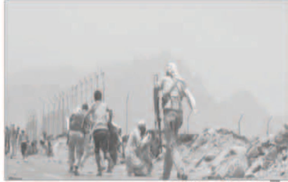
المقاومة اليمنية الثورت من محافظة شبوة