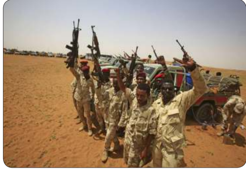
قوات «الدعم السريع» متهمه بارتكاب جرائم مروعة بحق المدنيين في السودان

«وكالات»: اندلعت اشتباكات عنيفة وسط قصف مدفعي متبادل بين الجيش السوداني وقوات الدعم السريع في العاصمة الخرطوم، في ظل اتهامات للدعم السريع بارتكاب مجزرة في قرية ود العشا بولاية الجزيرة وسط السودان. وقالت مصادر محلية للجريدة إن اشتباكات اندلعت بين الجيش والدعم السريع في محيط سلاح المدرعات التابع للجيش السوداني جنوبي مدينة الخرطوم.