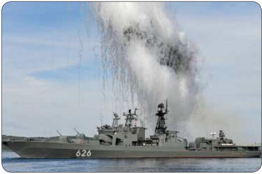
تدريبات بحرية روسية

السوفيتية على الجزر الأربع الواقعة قبالة هوكايدو اليابانية، في نهاية الحرب العالمية الثانية، وظلت في أيدي موسكو، مما منع البلدين من توقيع معاهدة سلام. بدورها، أفادت وزارة الدفاع الروسية سابقا، عن بدء مناورات بحرية واسعة النطاق تحت القيادة العامة للقائد العام للبحرية الروسية، الأدميرال ألكسندر مويستيف، في 30 يوليو (تموز) الماضي. وتشمل التدريبات نحو 300 سفينة سطحية وزوارق وغواصات وسفن دعم، وما يصل إلى 50 طائرة، وأكثر من 200 وحدة من المعدات العسكرية والخاصة، بالإضافة إلى أكثر من 20 ألف فرد. وذكرت أن اطقم السفن والطيران البحري ووحدات القوات الساحلية لأساطيل الشمال والمحيط الهادئ وبحر البلطيق وأسطول بحر قزوين، ستقوم بإجراء أكثر من 300 مناورة قتالية مع الاستخدام العملي للأسلحة.