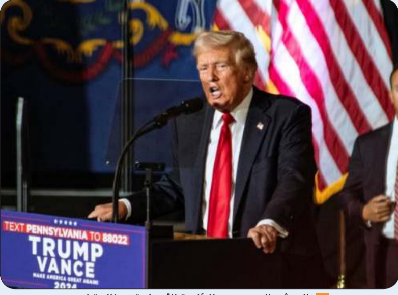
المرشح الجمهوري للرئاسة الأمريكية دونالد ترامب

الواضح أنها لا تفعل ذلك، لأنها كانت هندية طوال الوقت، ثم فجأة قامت بالانتقال وأصبحت شخصا أسود». وهذه التعليقات الاستفزازية التي أدلى بها المرشح الجمهوري للرئاسة، هي الأحدث في سلسلة من الهجمات الشخصية المتزايدة التي يشنها على هاريس، التي اتهمها أيضا هذا الأسبوع -وهي المتزوجة من يهودي أمريكي- بمساعدة البيت الأبيض إلى الرّد على تعليقات ترامب ووصفها بأنها «مهينة».