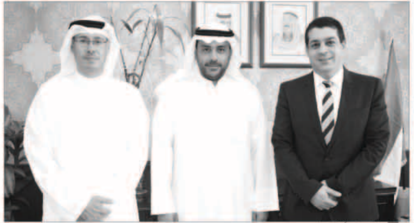
الرئيس متوسفاً الكخب والأوب

الرشيد: حريصون على إعداد جيل جديد يتقن تماماً آخر التطورات التكنولوجية في العالم