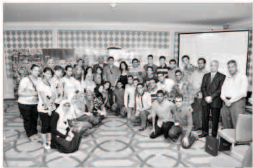
جانب من حفل التكريم