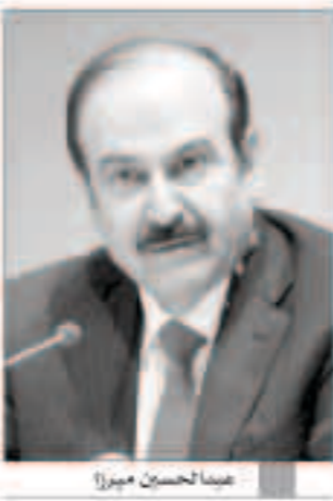
عبد الحسين ميرزا

المقامة - «رويترز»: قال وزير الطاقة البحريني عبد الحسين بن علي ميرزا إن من المتوقع أن تستنفذ توسعة مصفاة سترة لتكرير النفط في المملكة نحو خمسة مليارات دولار مرجحاً أن تدخل المصفاة حيز التشغيل في 2019. وذكر الوزير أنه تمت ترسية الأعمال الهندسية والتصميم ومن المقرر أن تكون جاهزة ببداية الربع الأول من 2016.