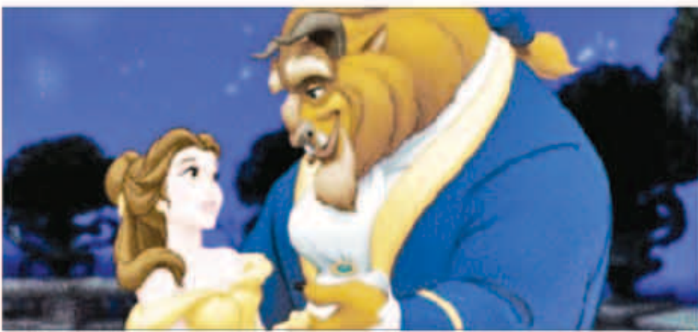
مشهد من مسرحية «الجميلة والوحش»

تقدم عرضها في باريس للموسيقار «الآن متكين» و«الجميلة والوحش» تدور حول عندما يتحول أحد الأمراء إلى وحش دميم على يد ساحرة أبي أن يضيفها في قلعه، ولم تكف بتحويله وإنما حولت كل عالمي القصر من الخدم إلى أدوات منزلية على أن يعودوا لحالتهم الطبيعية إذا ما تعلم الأمير كيف يحب وكيف يحب، وعلى الجانب الآخر فتاة تدعى بل، كانت تعاني من الوحدة وعدم تفهم أهل القرية البسيطة لأحلامها وطموحاتها، ويلتقي الوحش ببل عندما تذهب للغصن لتحرير والدها موريس المحجوز من قبل الوحش.