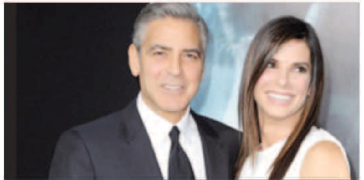
جورج كلوني وساندرا بولوك

وفي المركز الثالث جاء فيلم «Carrie» محققاً 17 مليون دولار، والفيلم بطولة كلو جريس موريتز وجوليان مور دور جابرييل وايلد ومن إخراج كيمبرلي بيرس.