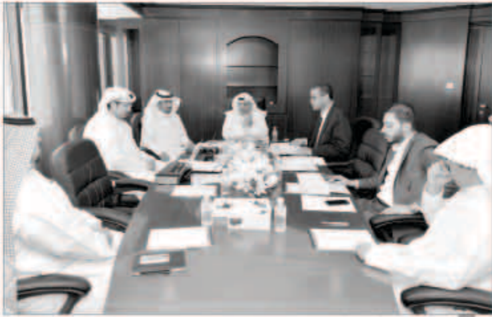
جانب من الجمعية العمومية

■ وضع خطة لإدراج الشركة في سوق الكويت للأوراق المالية بحلول 2021