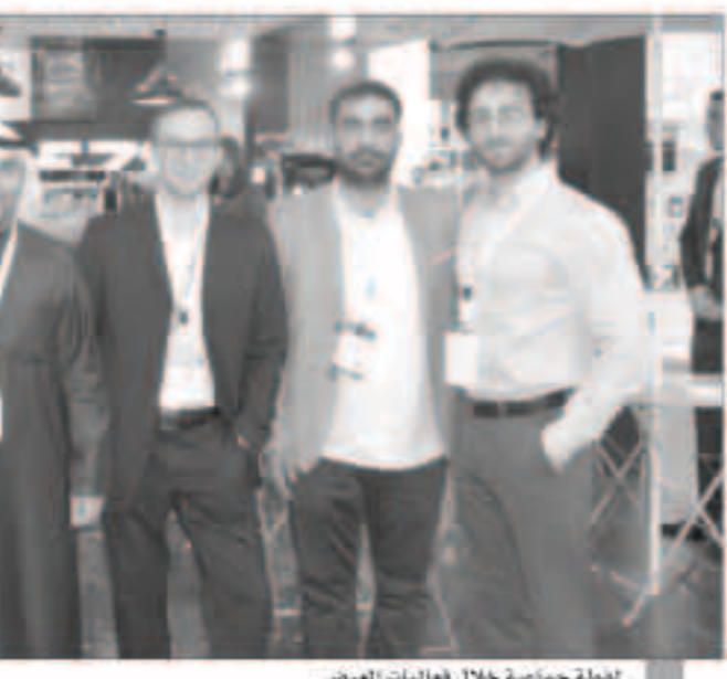
مجموعة جنائية خلال فعاليات المعرض

أعلنت شركة علي عبدالوهاب المطوع التجارية عن رعايتها الضميمة لمعرض «هوريكا الكويت 2018»، التخصص في قطاع الضيافة والصناعات الغذائية والتجهيزات الفندقية، والتي تحت رعاية معالي وزير التجارة والصناعة ووزير الدولة لشؤون الشباب خالد شامسر عبدالله الروضان، في أرض المعارض في مشرف. وخلال مشاركتها في هذا المعرض أطلقت شركة علي عبدالوهاب المطوع التجارية العلامة التجارية الإيطالية «فيما»، الرائدة في إنتاج آلات صنع القهوة ذات الجودة العالية مستخدمة أحدث النظريات التكنولوجية في عالم صنع القهوة، وقد استعرضت في الجناح المخصص لها والممتد على مساحة 90 متر مربع، آلة صنع القهوة «فيما E71»، المتطورة ذات التصميم الإيطالي ونظام التحكم الحراري المثالي، كما تتميز هذه الآلة بشاشة تعمل باللمس لإنتاج القهوة الجوي الأمثل حيث أنتج لزوار الجناح أن يصنعوا قهوتهم بأنفسهم ويستمتعوا بإحساس من الرفاهية في محطة تذوق استثنائية وتجربة متكاملة. وبالإضافة إلى «فيما E71»، استعرضت شركة علي عبدالوهاب المطوع التجارية آلة تحضير القهوة «فيما E61»، المصنوعة من الفولاذ المقاوم للصدأ والتي تعمل بالضخ الحجمي للحفاظ على الضغط خلال صنع القهوة. ومن أبرز العلامات التجارية التي استعرضتها شركة علي عبدالوهاب المطوع التجارية في الجناح المخصص لها في المعرض هي العلامة التجارية «ويبري» والعلامة التجارية الفرنسية «فيرموب»، الرائدة في تصنيع منتجات الأثاث الخارجي والعلي المريح ذي الجودة العالية والتصنيع وفق المعايير العالمية ليتناسب مع المستوى الراقي للتجهيزات الفندقية وخدمات الضيافة والمطاعم، والعلامة التجارية «سودي»، التي توفر أكثر من 200 صنف من مختلف المنتجات «بيوبيتر»، العلامة التجارية الشهيرة للحبوب الغذائية، «هيرلي»، والبيترز.