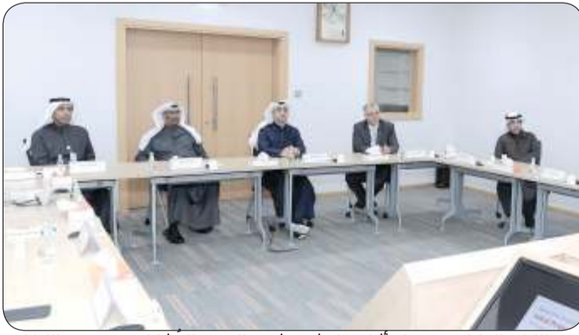
■ الإدارة العليا في بوبيان أثناء مناقشة مشروع الفريق المشارك في تحدي الابتكار

التنفيذ السنوية مؤسسة الكويت للتقدم العلمي، إذ يُركز على الابتكار والإبداع وتعزيز المهارات لتحقيق النمو المستدام وغرس روح التطوير والإبداع في فريق العمل، كما يعد بمثابة تجربة علمية يقضي خلالها المشاركون ثلاثة أشهر في التعلم والتدريب واستكشاف طرق لإحداث التغيير الإيجابي داخل مؤسساتهم، ليقيم كل فريق بمعالجة وحل تحد ما خاص بالشركة خلال فترة التدريب في البرنامج من خلال عرض فكرة المشروع على الحضور ومناقشته والرد على الاستفسارات مما يعزز ثقافة الابتكار داخل كل مؤسسة.