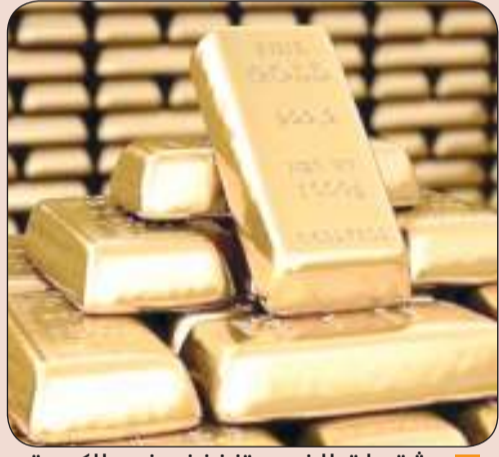
■ مشتريات الذهب تنخفض في الكويت

انخفض حجم مشتريات الذهب في دولة الكويت خلال عام 2024 بنحو 6.12% سنويا، وفق بيان المجلس العالمي للذهب.