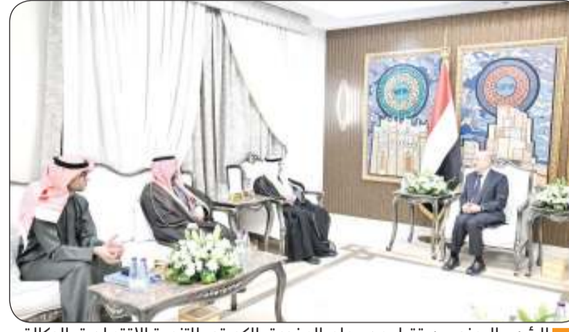
■ الرئيس اليمني يستقبل مدير عام الصندوق الكويتي للتنمية الاقتصادية بالوكالة

في ظل الأوضاع المالية والاقتصادية الصعبة التي فاقمتها هجمات المليشيات الحوثية الإرهابية على المنشآت النفطية وخطوط