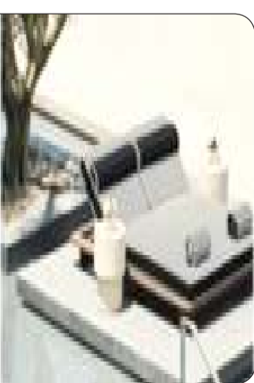
■ منتجع ون أند أونلي أيستيسز أعلن عن تعاون خاص مع علامة «بلمان»

كشفت منتجع ون أند أونلي أيستيسز، الذي تم افتتاحه مؤخراً في اليونان ويرحب الآن بالضيوف في موسم الصيف الافتتاحي، عن تعاون خاص بين علامتي بلمان وون أند أونلي لإضفاء لمسة من «الأسلوب الفرنسي الجديد» على الريفيرا الأيقونية، بما في ذلك الاستحواذ على نادي المسبح لفصل الصيف من وحي مجموعة دار الأزياء الباريسية لما قبل الخريف، ناهيك عن مجموعة محدودة الإصدار من تصاميم Cabas 1945 المتبعة المتطورة حصرياً لضيوف ون أند أونلي.