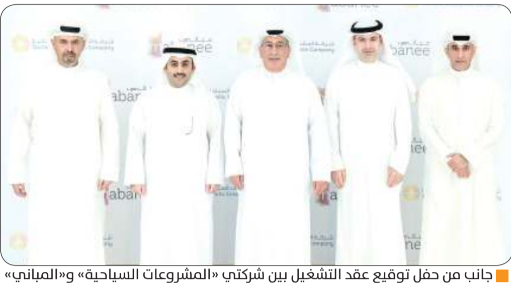
■ جانب من حفل توقيع عقد التشغيل بين شركتي «المشروعات السياحية» و«المباني»

العقد يمثل معنى الشراكة الفعالة بين «المشروعات السياحية» وشركة المباني بهدف قيادة وإحياء السياحة الداخلية