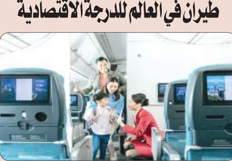
كاثي باسيفيك تفوز بجائزة أفضل شركة طيران في العالم للدرجة الاقتصادية وترسخ مكانتها بين أفضل خمس شركات طيران في العالم