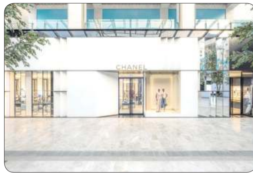
مجموعة ايتوال تتوسع في الخليج

بين الرخام الأبيض من فينيسيا والرخام الوردي من البرتغال ورخام العقيق المتداخل الألوان، في حين تتألق واجهته الخارجية بالأحجار الجيرية الجميلة. وتزين أرضية المتجر بالسجاد المغربي الأنيق لتعكس أسلوب العلامة الحيوية والفريد. ويحتضن المتجر تصاميم مختارة بعناية من أحدث تشكيلات الأزياء الجاهزة للرجال والسيدات والمنتجات الجلدية والإكسسوارات والنظارات والعطور ليضمن تجربة تسوق راقية. شأنيل ساهمت مجموعة ايتوال في جلب علامة شأنيل إلى منطقة الخليج العربي في العام 1983، حيث استمر هذا التوسع وتم افتتاح عدة متاجر لشأنيل على مدار 4 عقود. وافتتحت مجموعة ايتوال متجر شأنيل الجديد في مارس 2024 في الطابق الأول من مراسي جاليريا مول في المنامة بالبحرين لتقدم تجربة تسوق فاخرة عبر ثلاثة أقسام مميزة. ويعرض البوتيك أحدث تشكيلات الأزياء الجاهزة، إلى جانب مجموعة من النقائب والأحذية والنظارات والإكسسوارات، إضافة إلى منطقة مخصصة للساعات والمجوهرات الراقية وقطع المجوهرات الأيقونية، ومجموعة من المجوهرات الفاخرة والساعات النادرة. ويمكن استخدام المدخل المخصص داخل المتجر للوصول إلى متجر شأنيل للعطور والتجميل والذي يحتضن عطور الدار ومستحضرات التجميل ومجموعات العناية بالبشرة. ويجمع بين البيوتيك الذي صممه المهندس المعماري بيتر مارينو، بين الرخام الأسود والحجر الأبيض والمرابا، مما يوفر أجواءً عصرية بلسمات من فن الأرت ديكو. وفي أبريل 2024، كشفت العلامة التجارية عن حلة جديدة لبوتيك شأنيل في الطابق الأرضي من مجمع الصالحية التجاري في مدينة الكويت؛ ويحتفي المتجر ببارث علامة شأنيل مع إبداعاتها ويضمن للعملاء تجربة تسوق فريدة من نوعها.