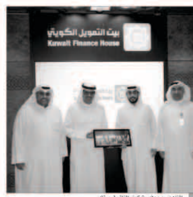
التامع مع وفد من الجزائر، بيتك