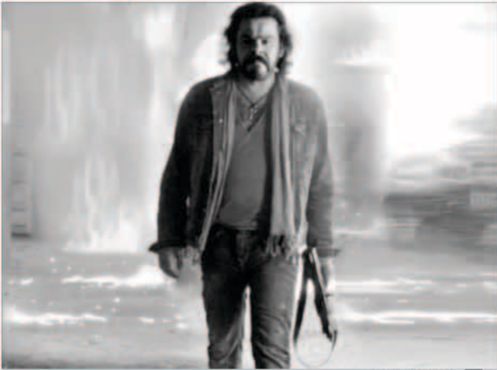
مئذر رياحة في «العقرب»

مسلسل موجه حارة هو الآخر سيستمر تصويره في رمضان المقبل، ولكن من المتوقع أن ينتهي صناعة من تصويره خلال الأيام الأولى من رمضان فقط، وهو المسلسل الذي يعيد رواية الكاتب الكبير الراحل أسامة أنور عكاشة «منخفض الهمد الموسمي»، إلى النور من جديد، حيث قامت السيناريست مريم نعوم بتحويل الرواية إلى سيناريو يتعاش مع الواقع الذي تعيش فيه مع تعديل بعض مشاهد الفلاش باك.