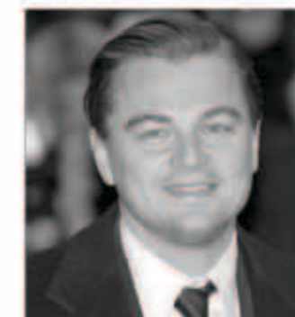
ليوناردو دي كابريو

ليوناردو دي كابريو رجل التحدييات يعزّم تجسيد شخصية «راسبوتين» الناسك الذي ساعد في شفاء الأسرة الإمبريالية الروسية وقتل عن عمر يناهز 46 عاماً في فيلمه الجديد.