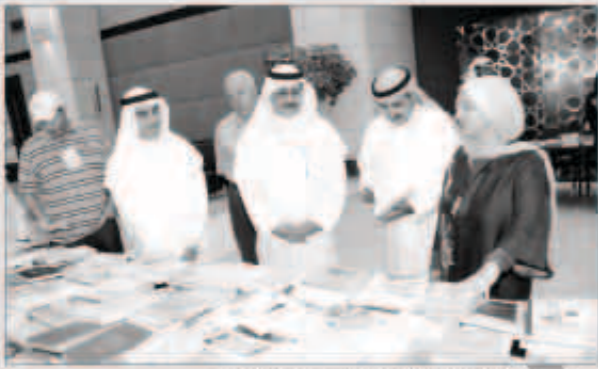
الدويش والأنصاري والمجمعي في المعرض

ضمن أنشطة مهرجان صيفي ثقافي 8 افتتح الأمين العام المساعد لقطاع الثقافة في المجلس الوطني للثقافة والفنون والآداب د. بدر الدويش ود.حسين الأنصاري مدير مكتبة الكويت الوطنية ود.سهيل العجمي مدير المهرجان معرض «إحياء مكتبتي» الذي يقيمته المجلس بالتعاون مع نادي ديوان للقراءة في مكتبة الكويت الوطنية واستمر حتى أمس.