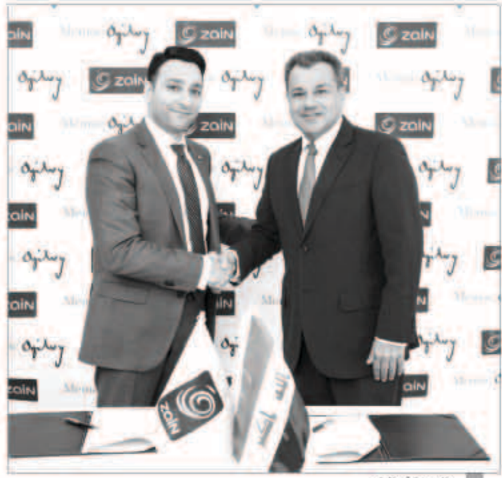
جانب من توقيع العقد

يذكر بان الاتفاق بين زين العراق وشركة «ميماك أوجلفي» والتي تقدم خدمات في مجالات الاعلانات والتسويق بالإضافة الى العلاقات العامة سيعزز من وجود زين العراق كرائدة في مجال الاتصالات في العراق وإرساء معايير عالية في الجودة والتفوق التقني.