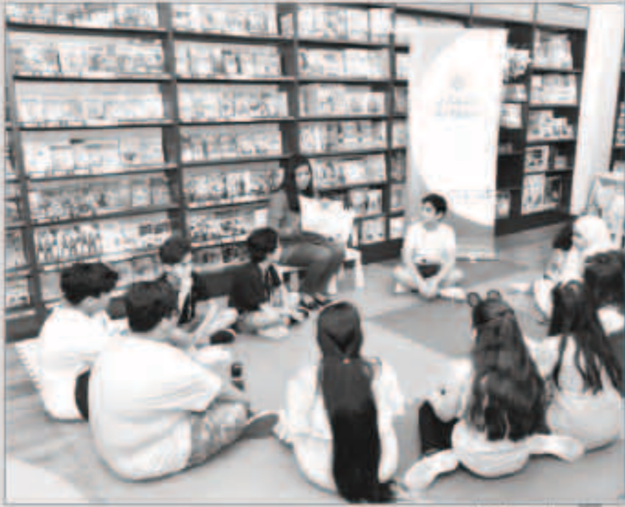
جانب من النشاط

هذا ويستطيع أولياء أمور أصحاب حسابي الأول الذين لم ينسئ لهم تسجيل أبنائهم في فعاليات الأسبوع الأول للقيام بتسجيلهم في الأنشطة المقلدة التي ستقام في 2 و 9 أغسطس وذلك من خلال زيارة قسم العروض على موقع البنك www.cbk.com أو بإمكانهم الاتصال على خدمة العملاء 1888225. ومن المعروف أن حسابي الأول هو حساب توفير مصمم خصيصاً للأطفال حتى 14 سنة، وبعد هذا الحساب هو الطريقة المثلى للآباء والأمهات الذين يرغبون في تأمين مستقبل أفضل لأبنائهم وتوفير الأموال لهم في مراحلهم العمرية المبكرة.