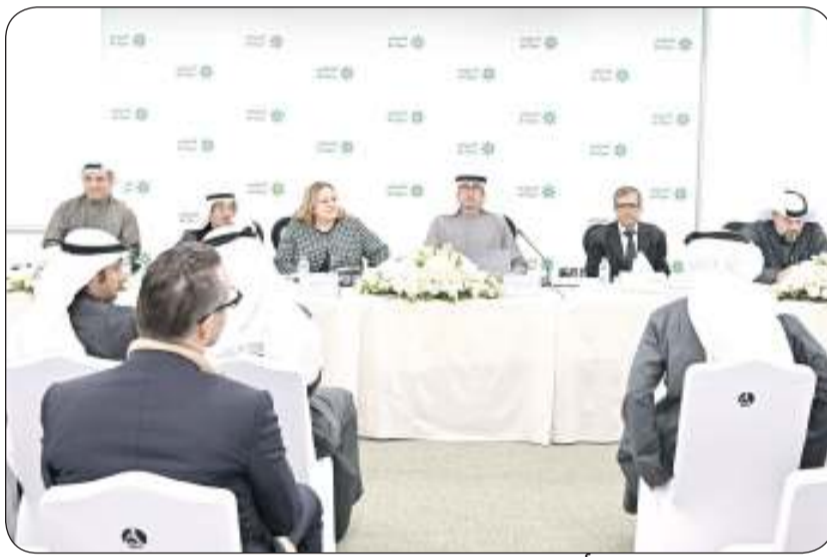
الشيخ أحمد دعيح الصباح خلال انعقاد الجمعية

بحضور رئيس مجلس إدارة البنك التجاري الكويتي الشيخ أحمد دعيح الصباح، انعقد اجتماع الجمعية العامة العادية للبنك التجاري يوم أمس الأربعاء الموافق 12 فبراير 2025 لمناقشة والتصويت على إلغاء القرار الذي تم اتخاذه في الجمعية العامة المنعقدة بتاريخ 19/12/2018 والذي ينص على عدم إصدار البنك لأي ميزانية ختامية تتضمن أية قروض متعززة بمعنى أن تكون نسبة القروض المتعززة NPL تساوي صفر وقد انعقدت الجمعية بعد